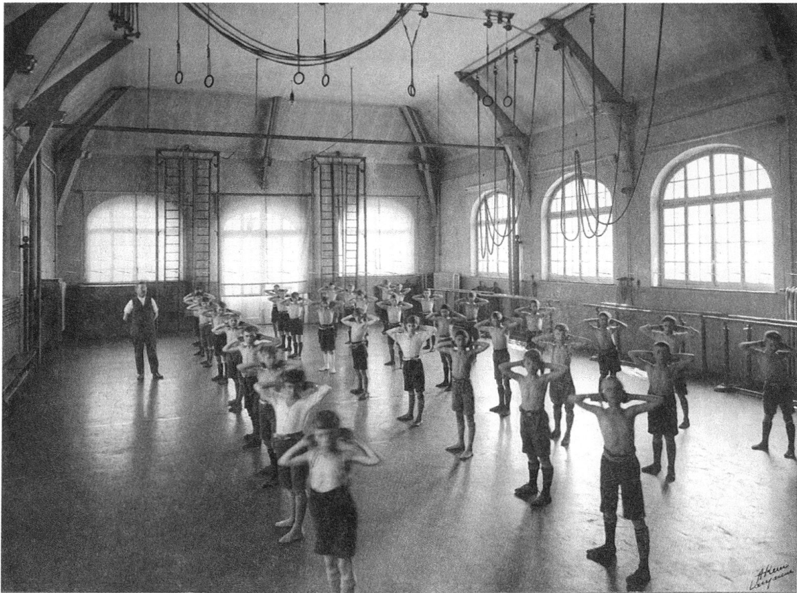
2 Leçon de gymnastique pour les garçons, André Kern, s.d.