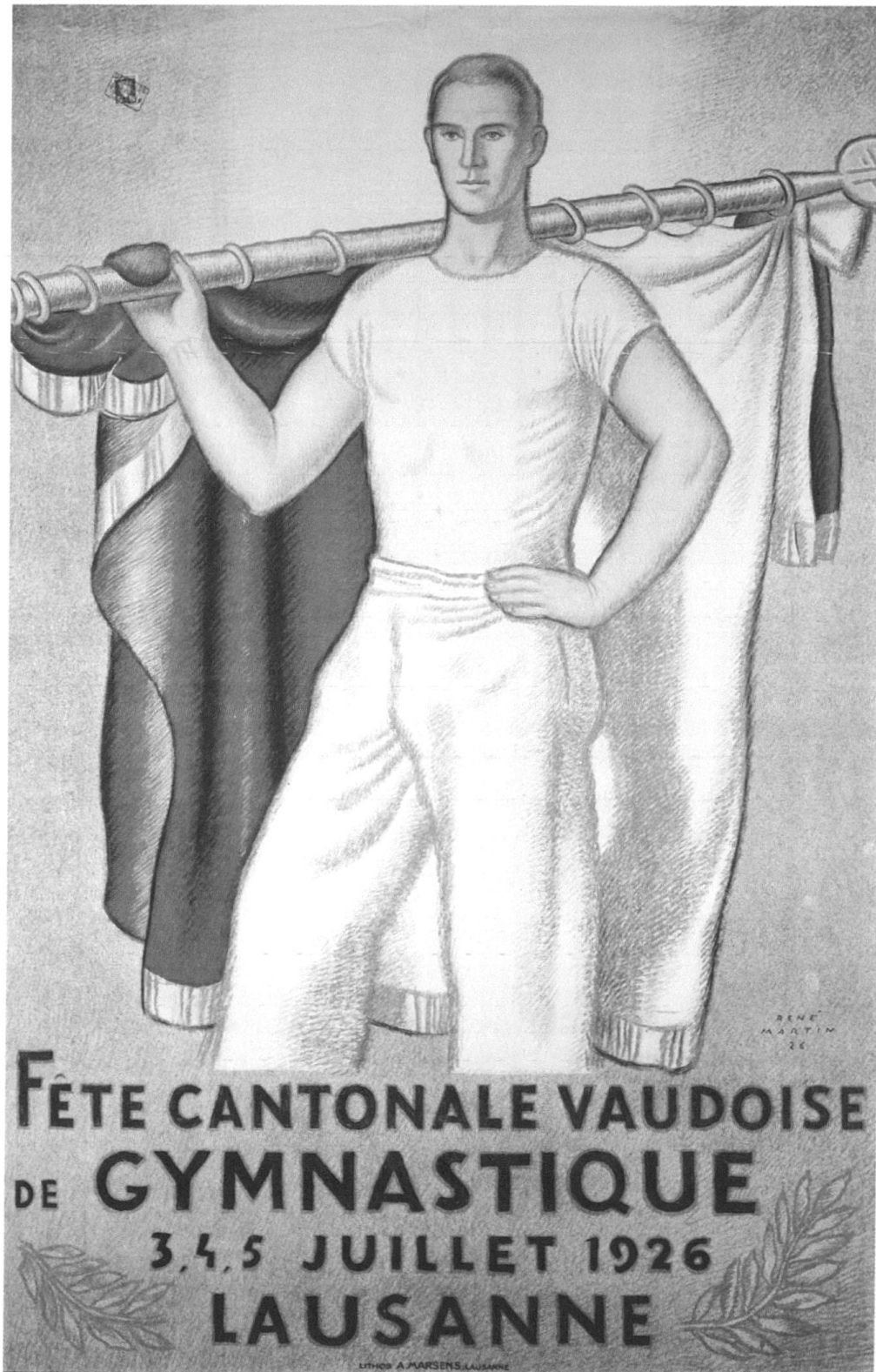
4 René Martin, Fête cantonale vaudoise de Gymnastique, 1926. Lithographie, 128 x 90 cm, Lithos A. Marsens, © MHL.