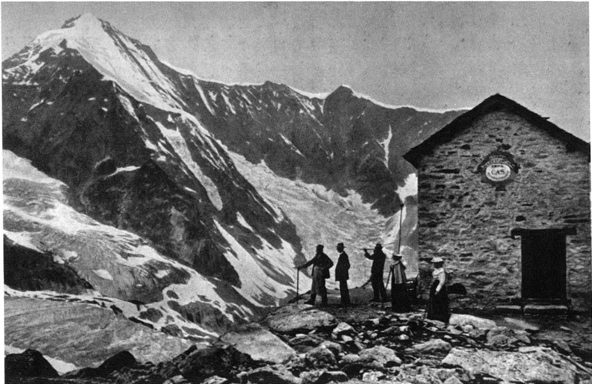
4 Émile Thury, Cabane du Mountet et Gd-Cornier, [s.d.]. L'Écho des Alpes , N°4, 1907.

recherche scientifique (FNS) 11 . Cependant, il était nécessaire d'évoquer brièvement la manière dont le CAS s'est inscrit dans le paysage social, politique, culturel et même économique de la Suisse du XIX e siècle, pour mieux comprendre comment cet engagement se traduit dans sa manière de concevoir et de promouvoir la pratique de l'alpinisme.