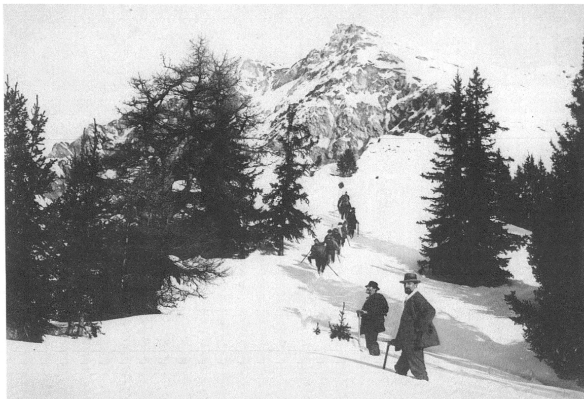
2 Course d'hiver à la Pierre à Voir [Section genevoise du CAS], janvier 1887, photographie, 12x17 cm.

« Sans vouloir enlever aux récits de courses et d'ascensions la place qu'ils ont occupée jusqu'ici dans ce recueil, la rédaction désire donner une part un peu plus grande aux travaux plus sérieux dont les Alpes sont l'objet. Loin de nous, toutefois, la pensée de transformer L'Écho en journal scientifique; nous parlerons toujours un langage facile à saisir, mais nous nous efforcerons d'ajouter l'utile à l'agréable. »