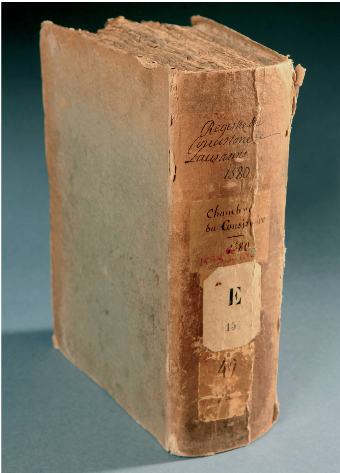
Fig. 1: Registre renfermant les procès-verbaux des séances du consistoire lausannois depuis 1538.