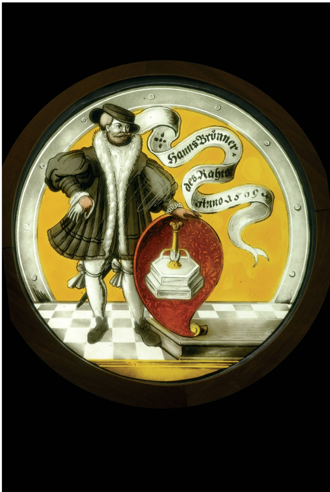
Fig. 2: Armoiries du conseiller bernois Hans Brunner 1569. © Musée historique de Berne, Inv. 33592.