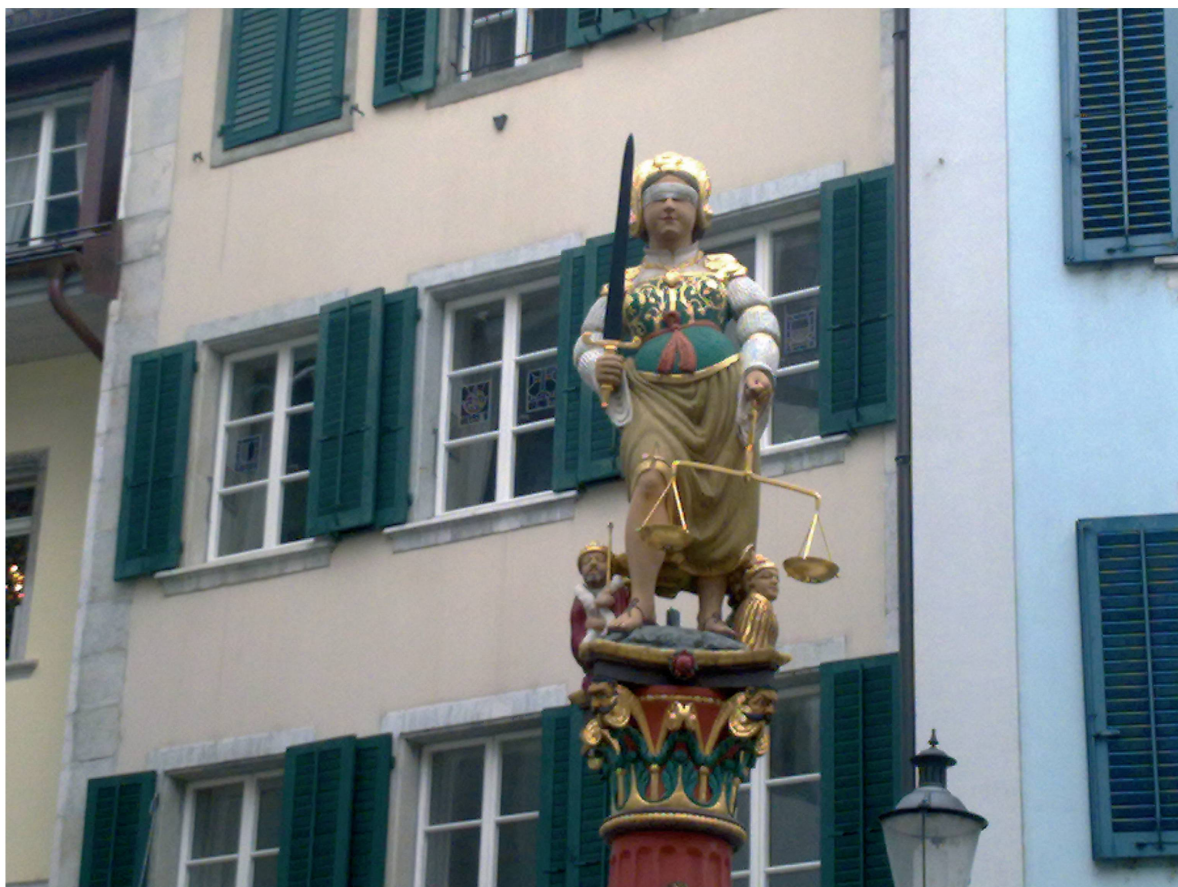
Fig. 3: Allégorie de la Justice , Laurent Perroud, 1561. Fontaine de Justice, Soleure, Hauptgasse.

toujours au sujet de l'été 1531 et dans le même registre qui lui fait exprimer des sentiments humains, le banneret ne peut retenir ses pleurs devant le départ des religieuses d'Orbe, qui « ainsi allèrent sans être vues ni vues de personne, sinon de moi, dit Banderet, qui fondis en larmes de l'horreur et pitié que j'avais ». Le banneret, précisément parce qu'il est incarnation du corps politique de la ville, sait tout des événements et de leur sens véritable et il est donc seul à pouvoir mettre par écrit « la déduction du toutage », le récit complet des événements, comme il le dit d'emblée. En ce sens, les Mémoires entendent bien construire un récit objectif, puisque le récit est celui de la communauté ou de celui qui la personnifie, sans renoncer à porter un jugement.