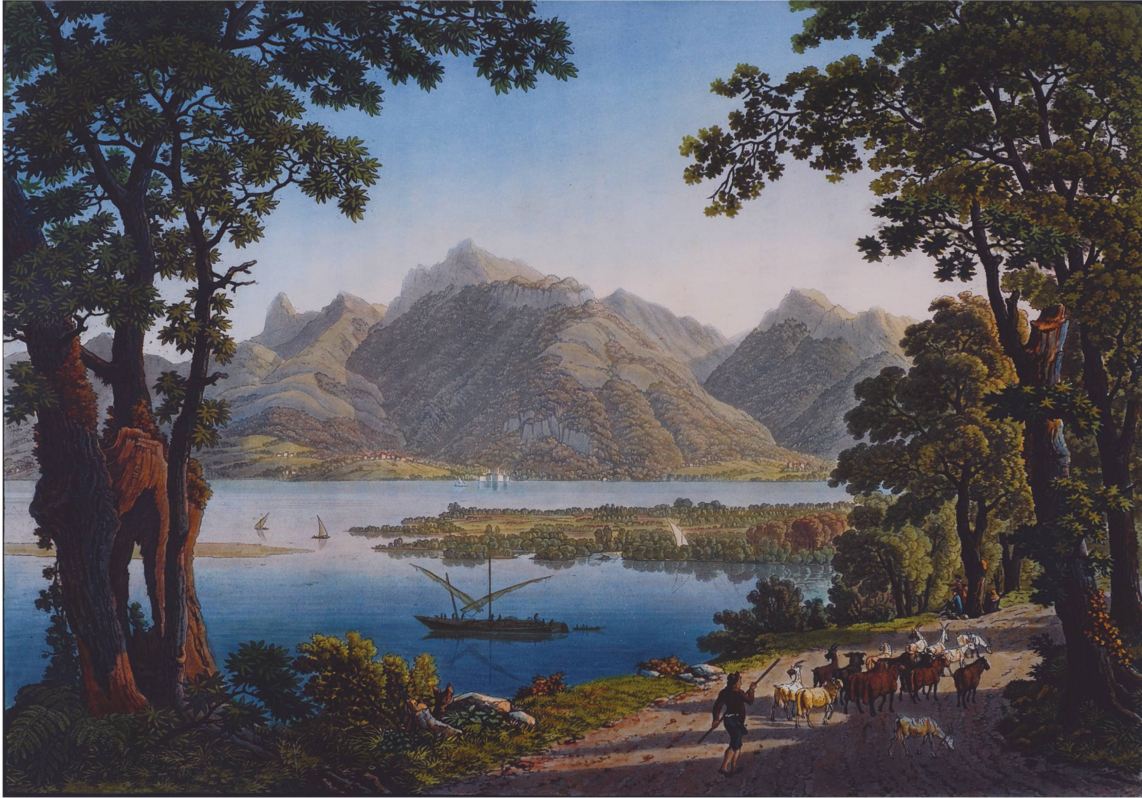
Fig. 4. Gabriel Lory père, «Vue de l'extrémité du Lac de Genève, et de l'entrée du Rhône près le Boveret», in Gabriel Lory, Voyage pittoresque de Genève à Milan par la route du Simplon , Paris: Imprimerie de P. Didot l'aîné, 1811. MV.

Ce dernier, formé dans l'atelier de son père, a su développer un style personnel qui, surtout dans ses aquarelles, lui confère une place de choix parmi les petits maîtres suisses 22 . L'édition in-folio du Voyage pittoresque de Genève à Milan par la route du Simplon 23 , sortie en 1811, est illustrée par 35 aquatintes coloriées, toutes réalisées par les deux Lory, à l'exception d'une seule qui est signée Maximilien de Meuron (1785-1868); cet artiste neuchâtelois de grand mérite, auquel Marie-Louis Schaller attribue aussi le texte de l'ouvrage 24 , avait voyagé en Italie en 1809 et parcouru la célèbre route