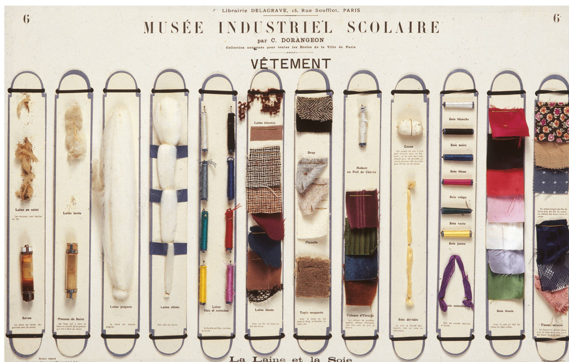
Tableau pédagogique Musée industriel scolaire de C. Dorangeon, édité par Delagrave, Paris, 1900. La caisse contenant la collection de 12 planches a été donnée en 1984 à l'Association du musée et de l'éducation par la Centrale de documentation scolaire.

constitue en 2000 la FVPS, désormais détentrice des collections, l'Association subsistant comme soutien. Les institutions patrimoniales sont officiellement représentées au conseil de la FVPS.