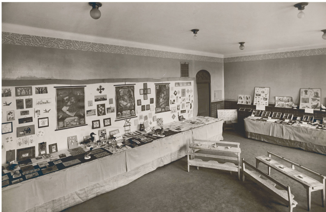
Photographie d'une exposition temporaire des écoles enfantines à Lausanne, vers 1925. Les expositions scolaires, temporaires ou permanentes, se propagent à des échelles différentes, internationales, régionales ou locales, surtout entre les années 1870 et 1920.