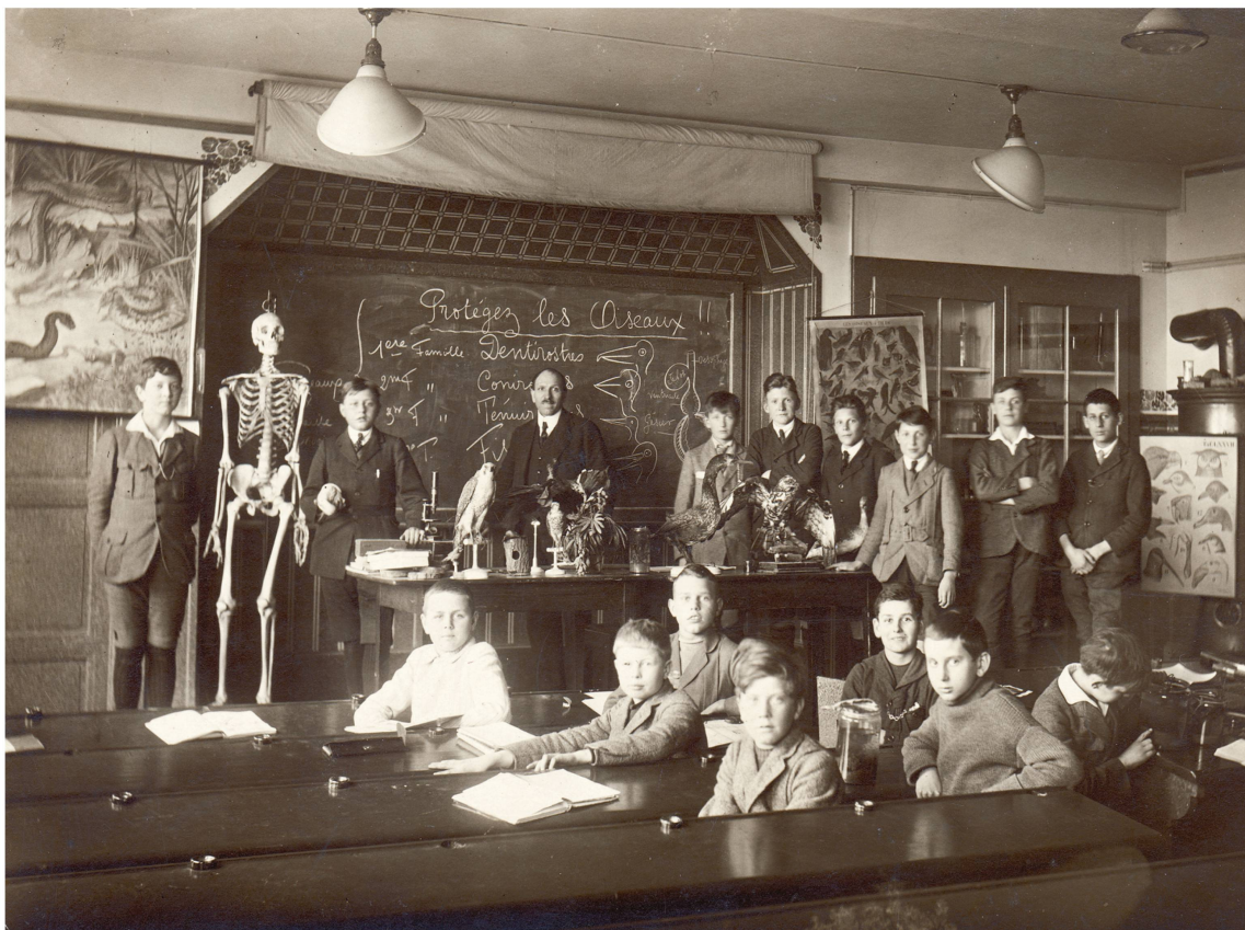
Photographie d'une classe de collège dans le canton de Vaud, 1919-1920. Les musées et les collections scolaires existent aussi dans les écoles, en particulier pour l'enseignement des sciences (squelettes, animaux empaillés, échantillons de matières premières et des productions artisanales ou industrielles).

Par ailleurs, le manque de ressources pénalise le renouvellement des collections, tous domaines confondus. Si certains musées honorent la mémoire de leurs grands pédagogues (Pestalozzi à Zurich, Fellenberg à Berne, Girard à Fribourg), à Genève « les «antiquités», ont disparu au profit d'une valorisation des tendances pédagogiques modernes» 19 . Cet avenir incertain n'empêche pas le secrétaire du comité directeur de l'Union et représentant de la Société pédagogique vaudoise d'affirmer dans son discours que le «Musée scolaire idéal» devrait comprendre: 1) «une section consacrée au Passé»; 2) «une classe modèle» actuelle et des documents correspondant aux «nouvelles tendances pédagogiques», 3) «la bibliothèque et les collections d'objets d'enseignement à l'usage des maîtres», afin de «suppléer à l'insuffisance du matériel d'enseignement de leurs classes et remédier à la pénurie de leurs collections» 20 .