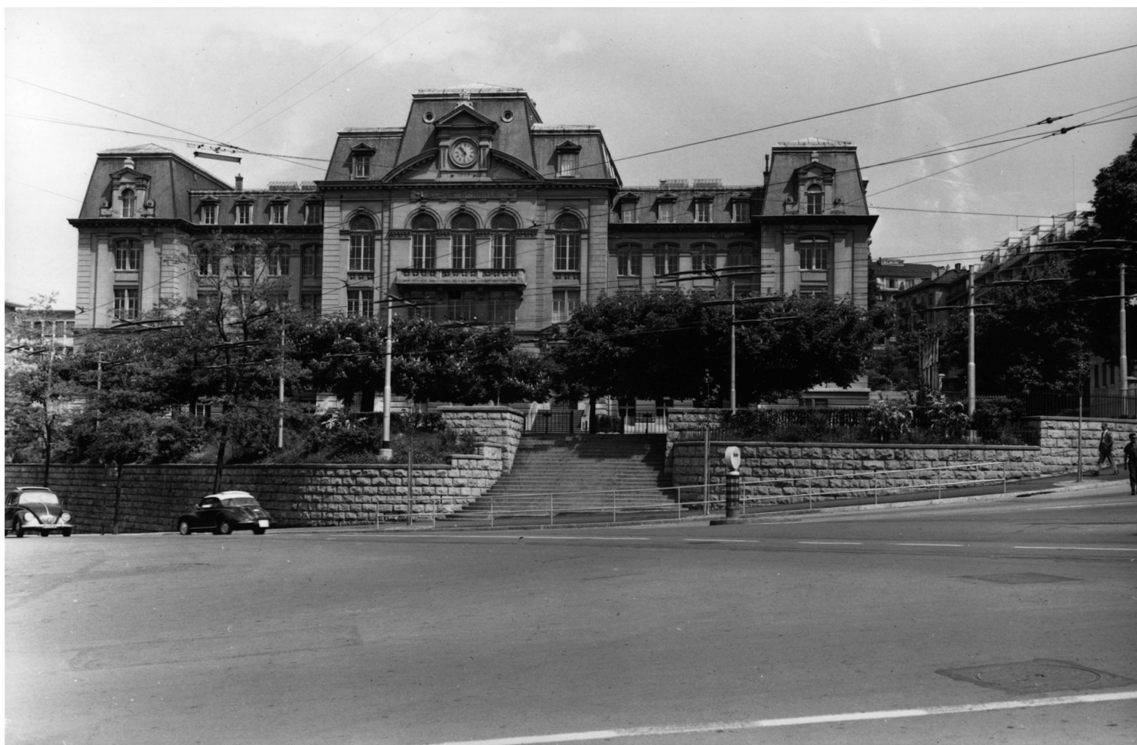
Photographie de l'École normale à Lausanne, 1958. Installé dans les combles dès 1901, le Musée scolaire cantonal présente les équipements et les méthodes utiles pour les écoles. Il devient la Centrale de documentation scolaire en 1951, puis déménage en 1958 lors des transformations du bâtiment.

En 1929, l'exposition permanente du Musée est complétée par un secteur consacré aux «œuvres parascolaires (classes gardiennes, cuisines scolaires, école de plein air, colonies de vacances)» et par une «classe primaire-type avec tout l'agencement nécessaire» 3 . Des photographies de ces aménagements, exposées à Montreux en 1932 en marge du Congrès de la Société pédagogique romande, n'ont malheureusement pas été retrouvées à ce jour. Les collections du musée, constituées grâce à des achats auprès des éditeurs ou des fabricants de matériel scolaire, à des dons ou à des échanges, comprennent entre autres des règlements et des programmes scolaires, des travaux d'élèves et de maîtres, des spécimens provenant d'expositions. Parmi les premiers dons reçus en 1897, on relève :