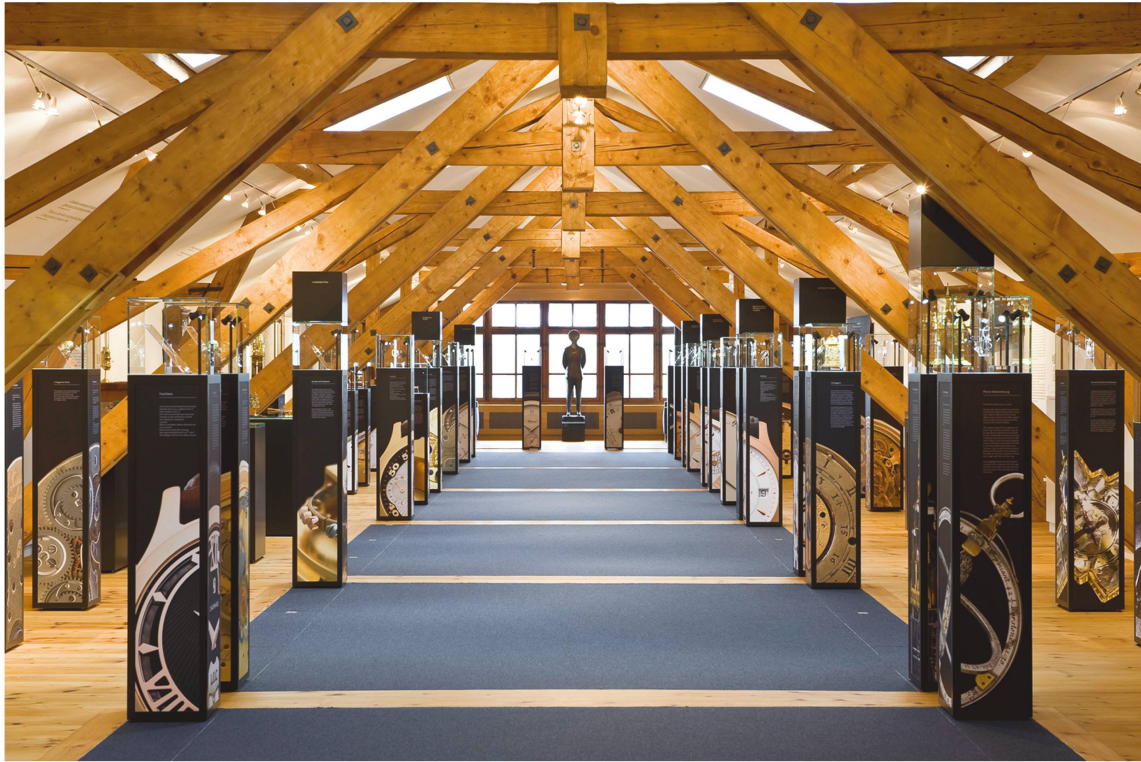
Le L.U.CEUM CHOPARD à Fleurier (jeu de mots avec lyceum et les initiales de Louis-Ulysse Chopard).

Môtiers (NE). Deux principales formes d'accueil et d'expositions au public sont à relever: la visite de site en activité qui prend un caractère de découverte d'activité et la journée portes ouvertes qui revêt un caractère événementiel, présentant la firme dans son secteur d'activité et la rapprochant de son environnement immédiat, par exemple les « Journées particulières » du groupe LVMH, qui ont attiré sur un week-end de juin 2013 quelque 120 000 visiteurs sur quarante-deux sites de production, dont les entreprises horlogères Zenith (Le Locle) et TAG Heuer (La Chaux-de-Fonds) 19 . La visite d'entreprise peut être ponctuelle, périodique, commémorative ou inaugurale.