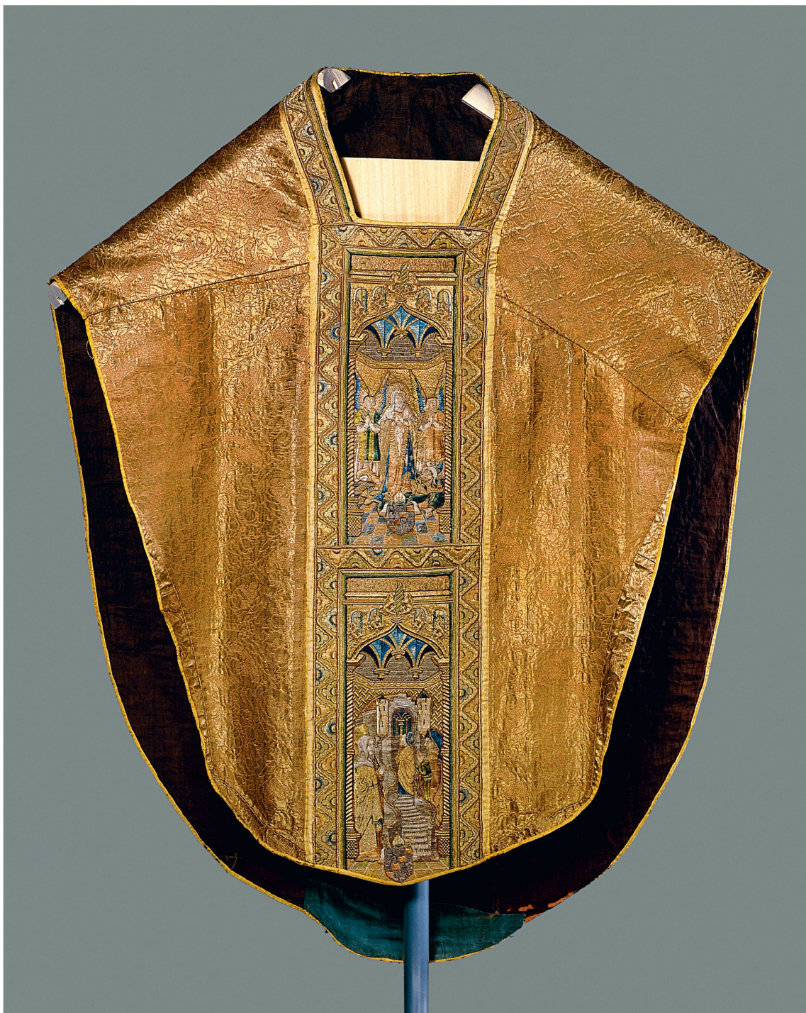
Chasuble de tissu d'or et de broderies provenant des parements liturgiques offerts par Aymon de Montfalcon à la cathédrale de Lausanne. Elle est illustrée sur le devant d'une scène représentant la conception de Marie avec au-dessus la devise de l'évêque « SI QUA FATA SINANT ». La deuxième scène représente la présentation de Marie au Temple. Italie et Flandres, premier quart du XVI e siècle.