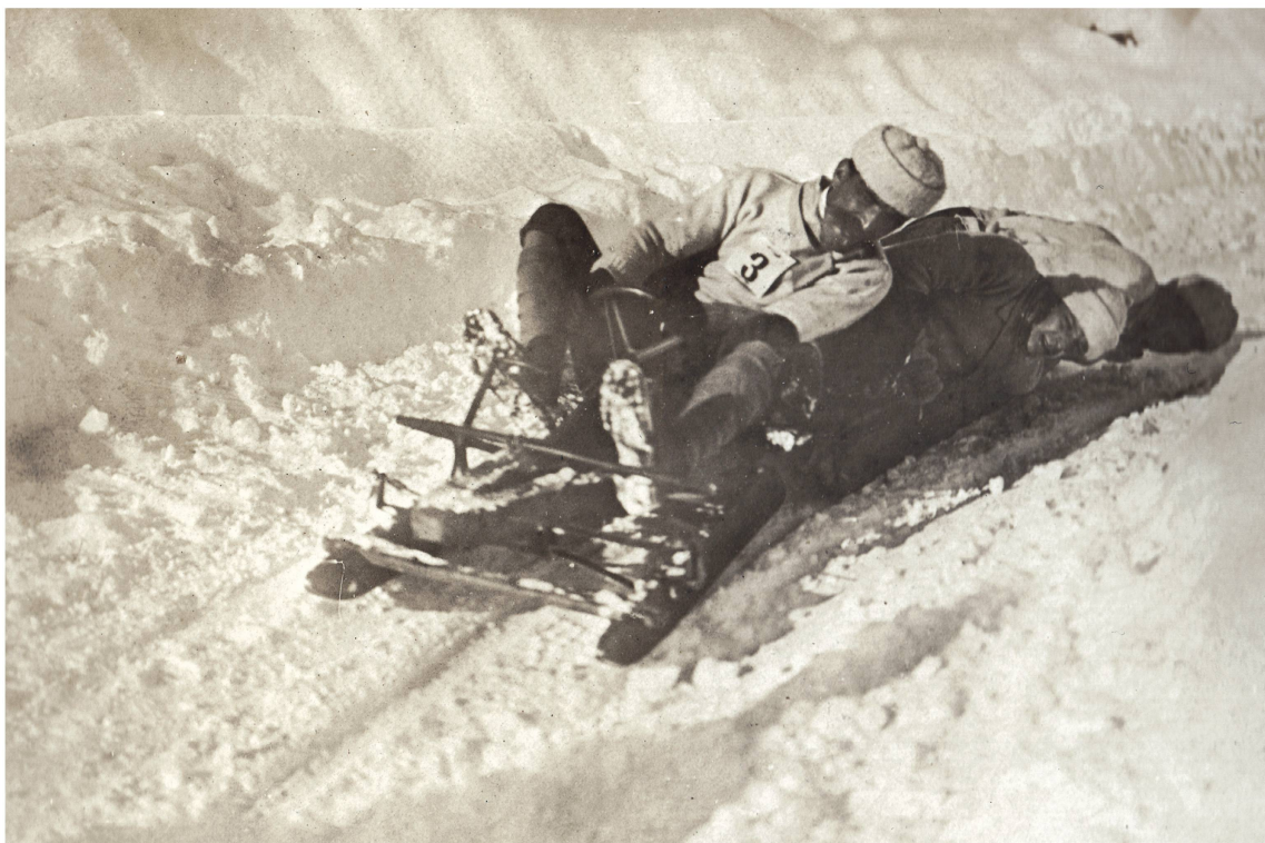
Course de bob au col de Sonloup, « L'Aventin », 1904.

Doté rapidement d'une piste de luge et d'une patinoire d'environ 2000 mètres carrés 22 , le Grand Hôtel propose à ses clients, dès les années 1880, des activités hivernales sportives. En ce sens, la station des Avants s'inscrit dans le prolongement des initiatives prises par les grandes stations des Grisons en matière de sport et participe activement à la mise en place des sports d'hiver en Suisse.