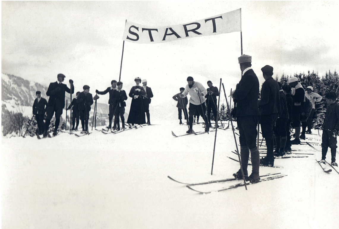
Course de ski aux Avants, hiver 1905-1906.

modernes qui font la fierté des grands établissements hôteliers des principales capitales européennes de cette époque, tels que le chauffage central, l'éclairage électrique, le téléphone ou encore l'ascenseur 45 . En ce qui concerne les installations sportives, il partage avec le Grand Hôtel des pistes de luge, des terrains de tennis, une place de patinage et une piste pour bicyclettes 46 .