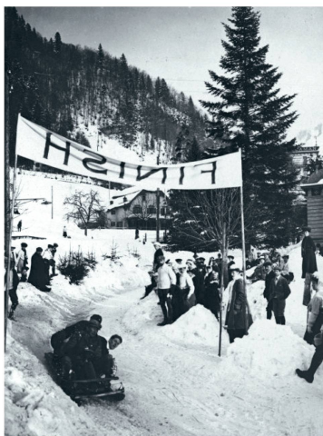
Arrivée d'une course de bob aux Avants devant le Grand Hôtel. Hiver 1905-1906.

place pour le curling 47 . La plupart de ces propositions vont se matérialiser au fil des ans, si bien qu'en 1912, le Grand Hôtel et le Caux-Palace disposent à eux deux de trois patinoires, dont une spécialement aménagée pour la pratique du curling 48 .