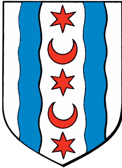
Armoiries de la Commune de Montreux-Châtelard.