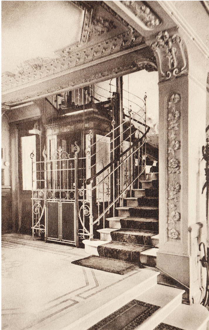
Ascenseur et cage d'escalier du Grand Hôtel de Clarens, (1905-1915), carte postale, 140 × 90 mm.

raccordé au réseau d'eau sous pression fournit par le LO qui lui garantit une pression minimum de 20 atmosphères, nécessaire à la manœuvre de leur appareil. Vendue à un prix de 10 ct le mètre cube, l'eau utilisée comme énergie reste bon marché. Écartant l'option de mouvoir l'ascenseur par leurs propres sources d'eau emmagasinées dans un nouveau réservoir construit à la Croix d'Ouchy, les administrateurs du Beau-Rivage renoncent une seconde fois à acheter de l'eau provenant de la SEAUL, car cette dernière ne peut leur garantir une pression plus grande que 8 atmosphères 23 .