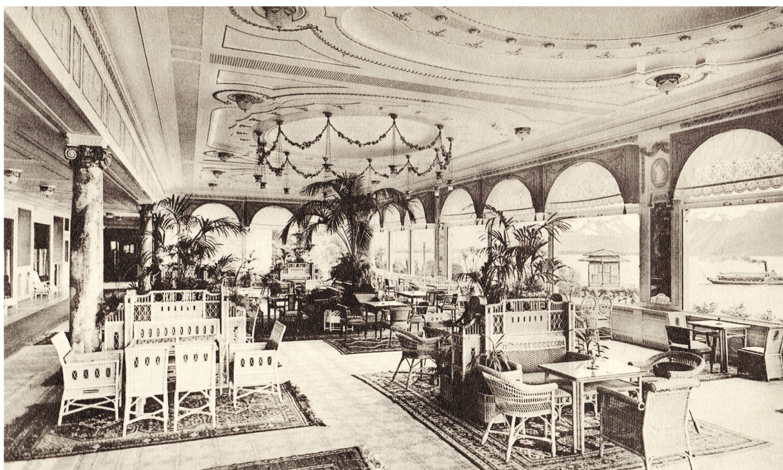
Éclairage électrique du jardin d'hiver du Grand Hôtel et Hôtel des Alpes de Territet, (1890-1915), carte postale, 140 × 90 mm.