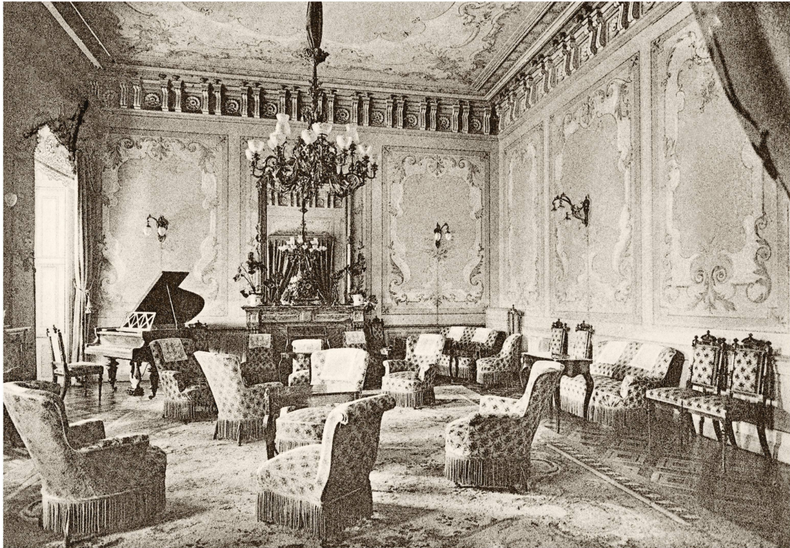
Éclairage électrique d'un salon de l'Hôtel Beau-Rivage à Ouchy (1908-1911).

La mise en place d'un système d'éclairage électrique nécessite toutefois de lourds investissements, tant financiers que techniques, qui vont parfois retarder l'introduction de cette commodité. À l'Hôtel Beau-Rivage, à Ouchy, la transformation du système d'éclairage au gaz en une installation électrique avec petite centrale hydraulique indépendante est repoussée jusqu'en 1894, moment où les administrateurs considèrent alors cette commodité comme prioritaire et indispensable :