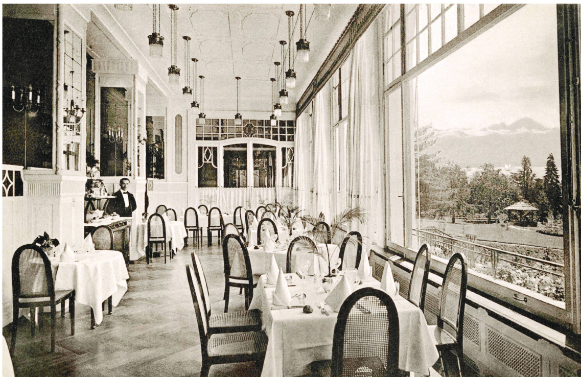
Éclairage électrique du restaurant de l'Hôtel Savoy à Lausanne, (1909-1920).