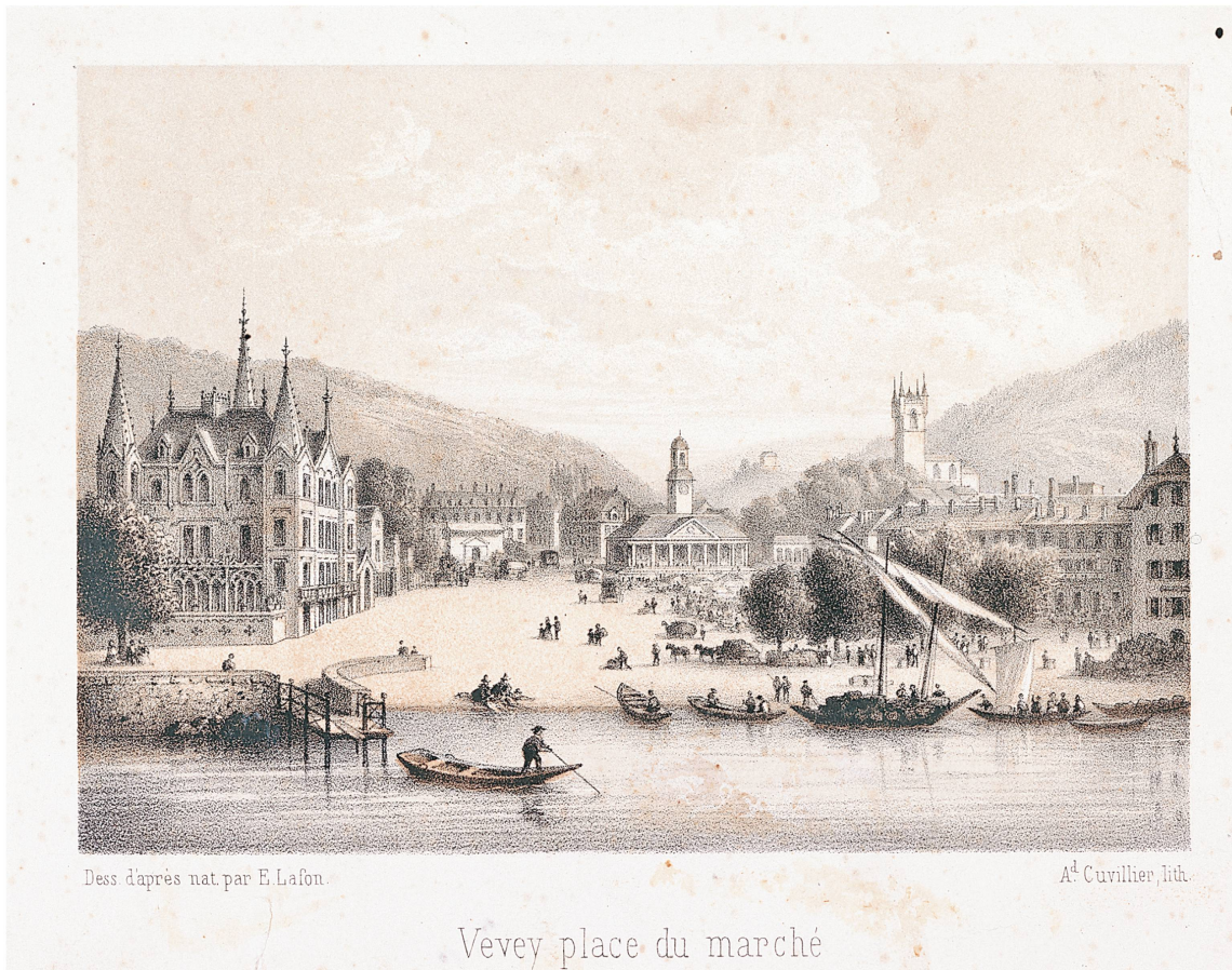
Dessin de E. Lafon, reporté par A.D. Cuvillier, La place du Marché de Vevey vue du lac , 1850, lithographie.

la vente du raisin, des moûts ou du vin, à l'encavage, aux vendanges ou encore au transport du vin. Régulièrement mise à jour, une demi-douzaine d'entre elles existe uniquement pour la seconde moitié du XVIII e siècle. Leur analyse est révélatrice des modifications et de l'évolution des politiques économiques et de leurs impératifs. Par exemple, la proscription des vins forains (étrangers à la commune), qui régit tout le XVIII e siècle, est levée dès les premiers jours de la Révolution vaudoise lorsque les échanges avec le Piémont, la Savoie ou encore la France sont réduits à néant par l'avancée napoléonienne. De même, l'interdiction de faire entrer du raisin par voie lacustre ou fluviale est significative d'une forme de contrebande contre laquelle les autorités veveysannes ont pris des mesures.