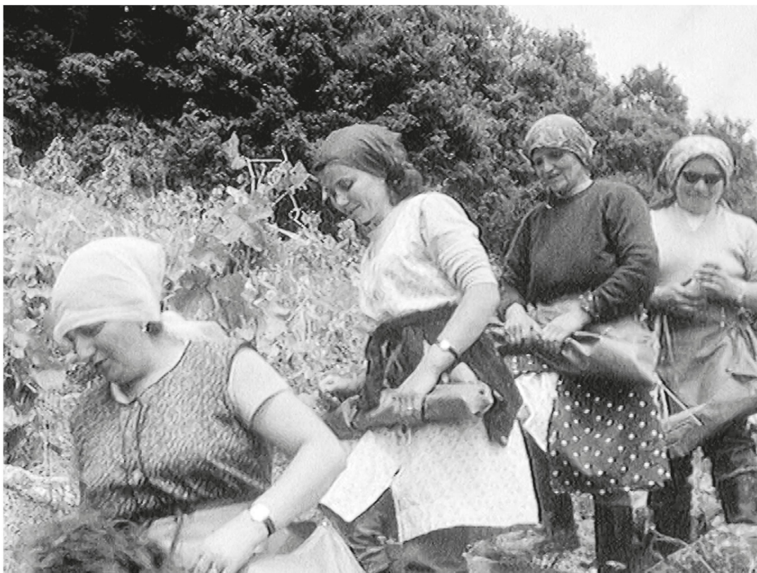
Les « effeuilleuses » : une vision marginale qui reconduit une division très sexuée du travail ( Madame TV , « Les effeuilleuses, interview d'Italiennes de la vallée d'Aoste », TSR, 16 juillet 1966).