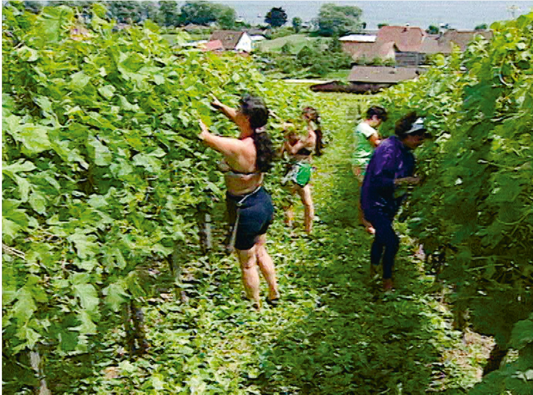
Balade en Romandie, RTS, 29 juin 1993.

visent à parer au morcellement des vignobles et à créer dévestitures et autres chemins d'accès propres à favoriser une certaine mécanisation. Ces aménagements, qui coïncident avec le développement d'une viticulture de plaine, ne sont pas sans créer la destruction de vignobles en terrasse, ce qui contribue à nourrir un débat public, dans les années 1970, sur l'importance d'un patrimoine paysager à préserver 37 .