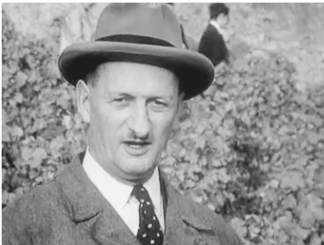
Les vendanges de Chaudet (RTS, 31 décembre 1959).

voit le développement des mouvements écologistes et, avec eux, une nouvelle sensibilité envers la dégradation de l'environnement 45 . Des luttes qui déboucheront sur la loi fédérale sur l'aménagement du territoire (LAT), adoptée le 22 juin 1979 et entrée en vigueur le 1 er janvier 1980. Le cadre réglementaire, qui tente de mieux redéfinir les logiques de construction tout en protégeant le paysage, est fortement contesté par les milieux immobiliers mais aussi par les héritiers d'une tradition fédéraliste qui ne veulent pas des ingérences « externes » sur les régions concernées.