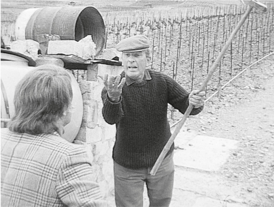
La confrontation ( Temps présent , « Qu'est-ce qui fait courir Franz Weber », 1 er juin 1972).

habitants de la région. Évoquant l'initiative Franz Weber, le vigneron vaudois lâche de manière très significative : « C'est surtout le vigneron qui a sauvé le Lavaux, qui a su exposer son problème » 43 . À travers la relecture de cet épisode, Étienne Fonjallaz passe sous silence les divisions de l'époque pour construire une forme de mémoire vigneronne héroïque où ce sont les autochtones qui s'attribuent le seul mérite de la conservation de ce bastion patrimonial. Franz Weber, incarnation de l'écologiste citadin, qui plus est ici alémanique, est renvoyé à son caractère « hors sol » qui l'associe, symboliquement, aux riches étrangers auxquels étaient destinés, selon les Pro Weber, les immeubles résidentiels qui devaient être construits au milieu des vignobles. Lavaux n'est pas la seule région vigneronne en prise avec cette problématique ; à la même période, par exemple, les vigneronnes du village valaisan de Plan-Cerisier se liguent contre un projet immobilier 44 . Ces confrontations s'inscrivent dans une période qui