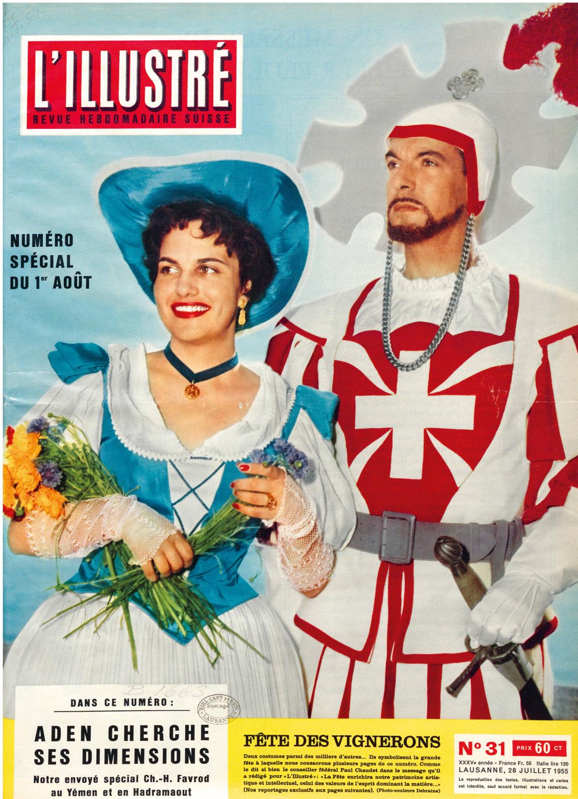
Couverture de L'Illustré , 1 er août 1955.