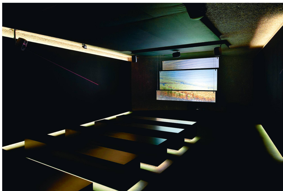
Promotion et pédagogie au Vinorama, sur la commune de Rivaz.