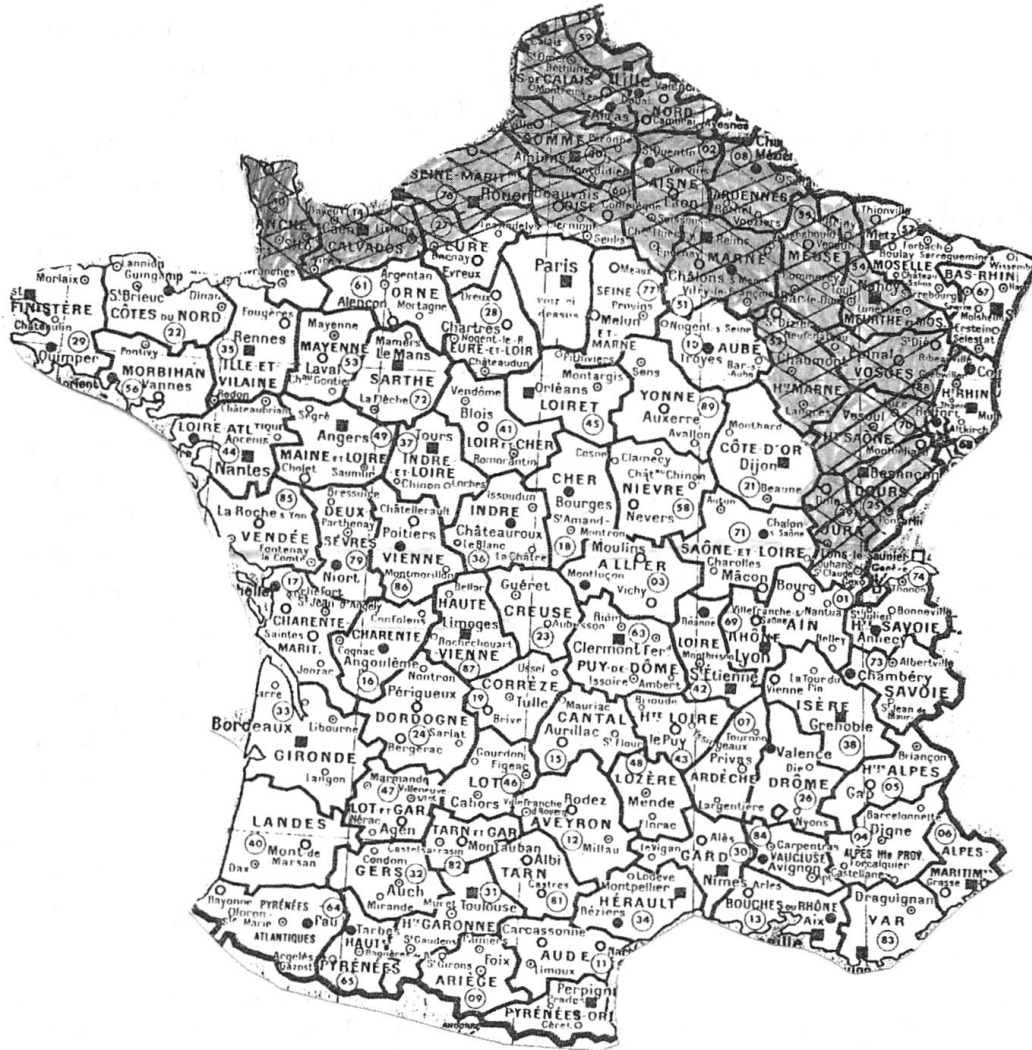
Carte du Couloir romanique

vement de progression des Romains, et donc de la langue latine, à partir de Lyon et de l'est du couloir rhodanien vers le nord, puis vers l'ouest.