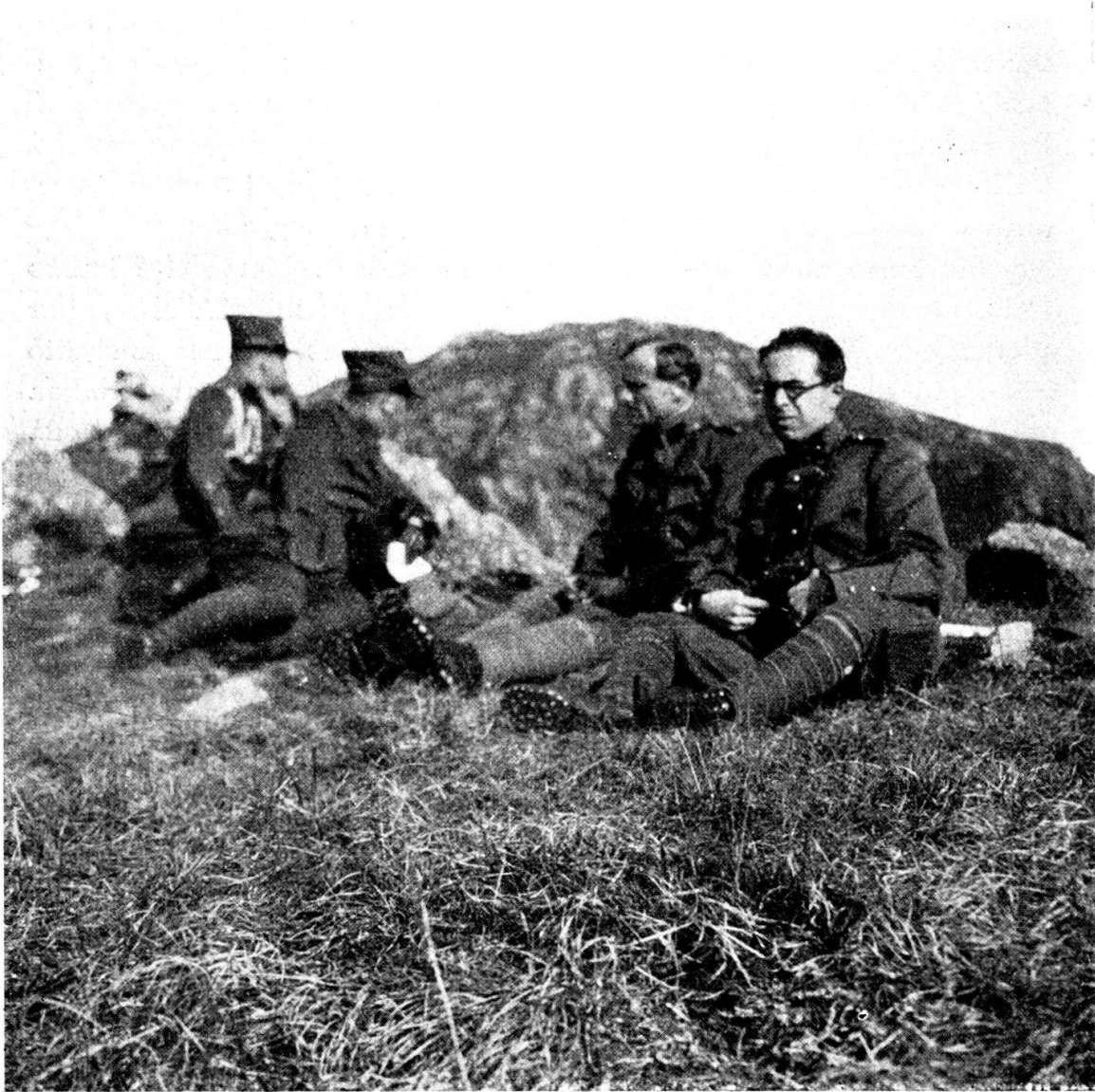
Alle manovre. Sosta.

Rinviato lo scorso marzo a causa di una leggera epidemia di grippe che serpeggiava fra la popolazione, il corso di ripetizione del Reggimento 30 ebbe luogo dal 28 ottobre al 9 novembre. Il rinvio è stato in due sensi felice, ha permesso al reggimento di presentarsi al completo, cioè anche col Bat. 94 il quale, se il corso avesse avuto luogo in marzo, avrebbe prestato servizio per proprio conto e ci ha fatto incontrare un bellissimo periodo di tempo autunnale, che ha be-