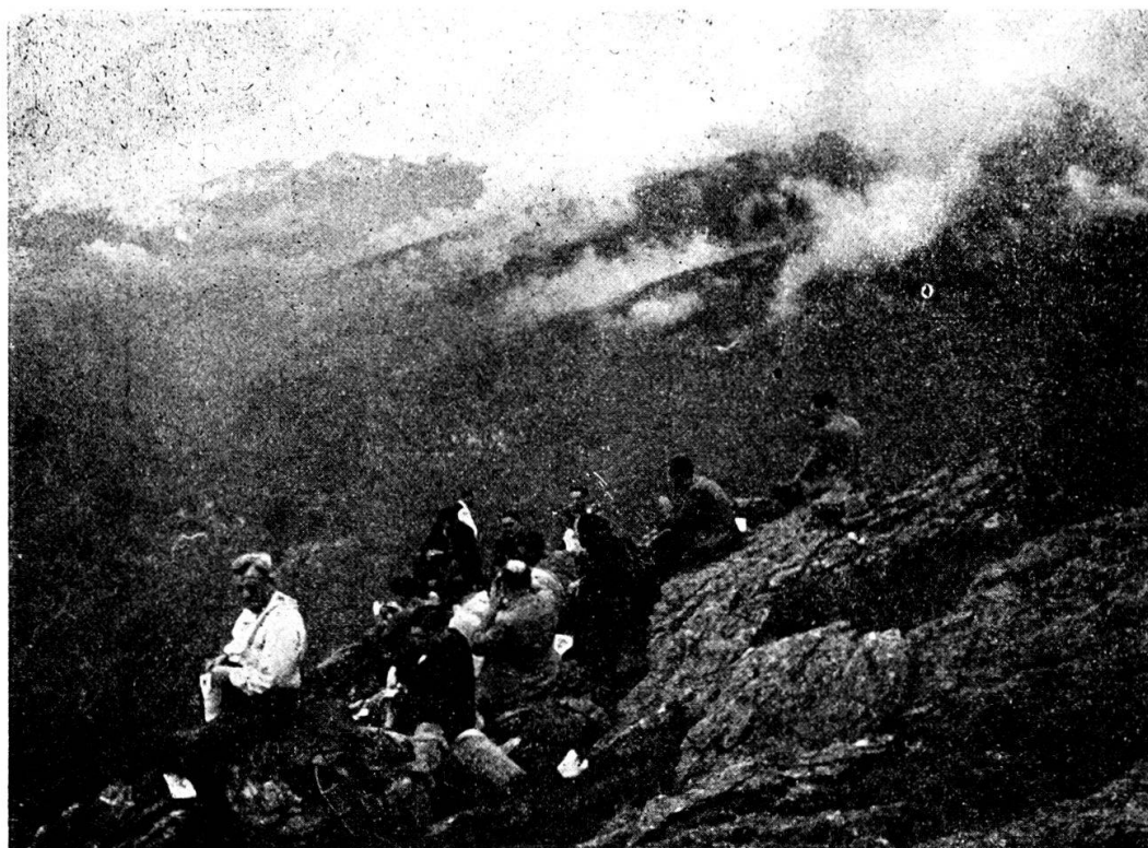
Verso la Gazzirola.

16. 4. 36. All'assemblea mensile con conferenza del sig. cap. C. Fontana sono presenti più di quaranta soci. Il Comitato esprime il suo disap-