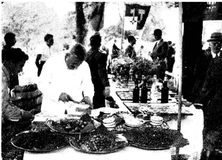
Fine di un corso d'equitazione...

L'esercizio, al quale partecipano una ventina d'ufficiali, incomincia con la difesa di Tesserete, prosegue con quella di Campestro, poi si inoltra nella valle fino all'alpe di Davrosio. I giovanissimi, quelli che vanno forte, vengono mandati al Cavaldrossa; essi ci raggiungeranno però ancora prima del pranzo. L'esercizio si distende poi in tutto l'interessante settore di Gola di Lago.