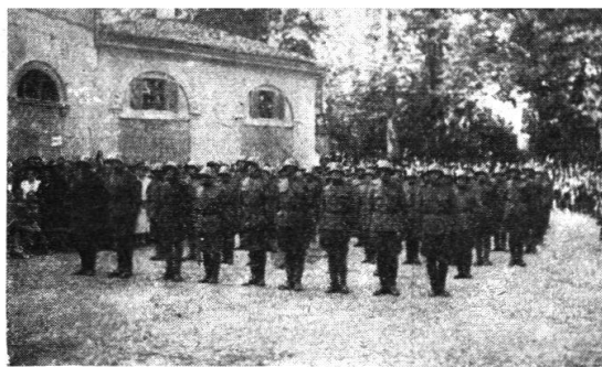
Il robusto quadrato dei concorrenti

La bella piana del Vedeggio con il suo giallo ed il suo verde sporco di autunno ha visto la contesa elegante dei cavalieri. Il troppo amore alle bestie ha limitato purtroppo la passionalità della contesa. I concorrenti, che avevano almeno due cronometri ai polsi con minimi due pulsanti sono stati però non solo dei buoni capi-treno che hanno saputo arrivare in orario ma anche degli eccellenti cava-