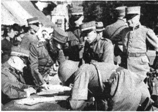
Al controllo di arrivo