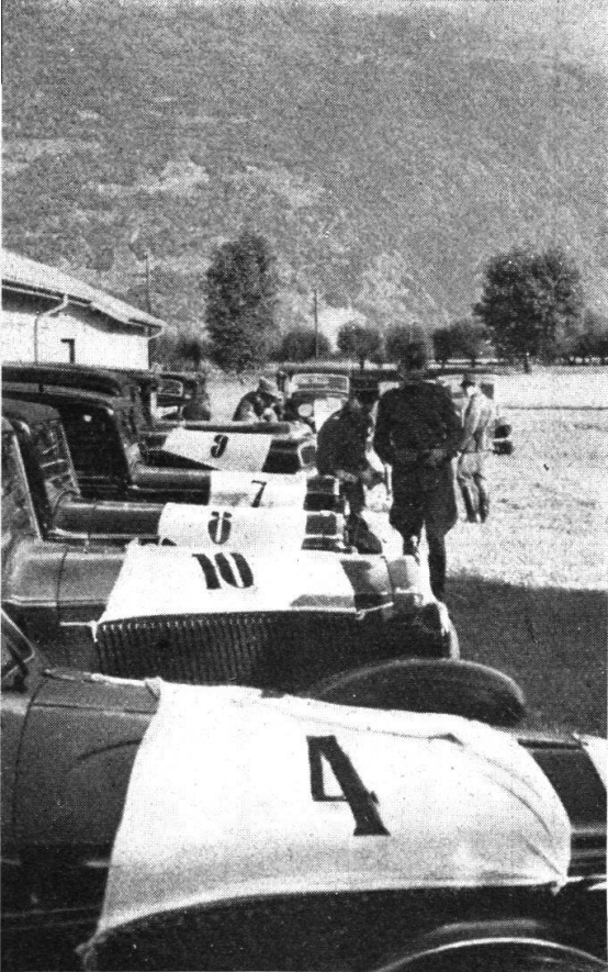
Le macchine ben allineate...