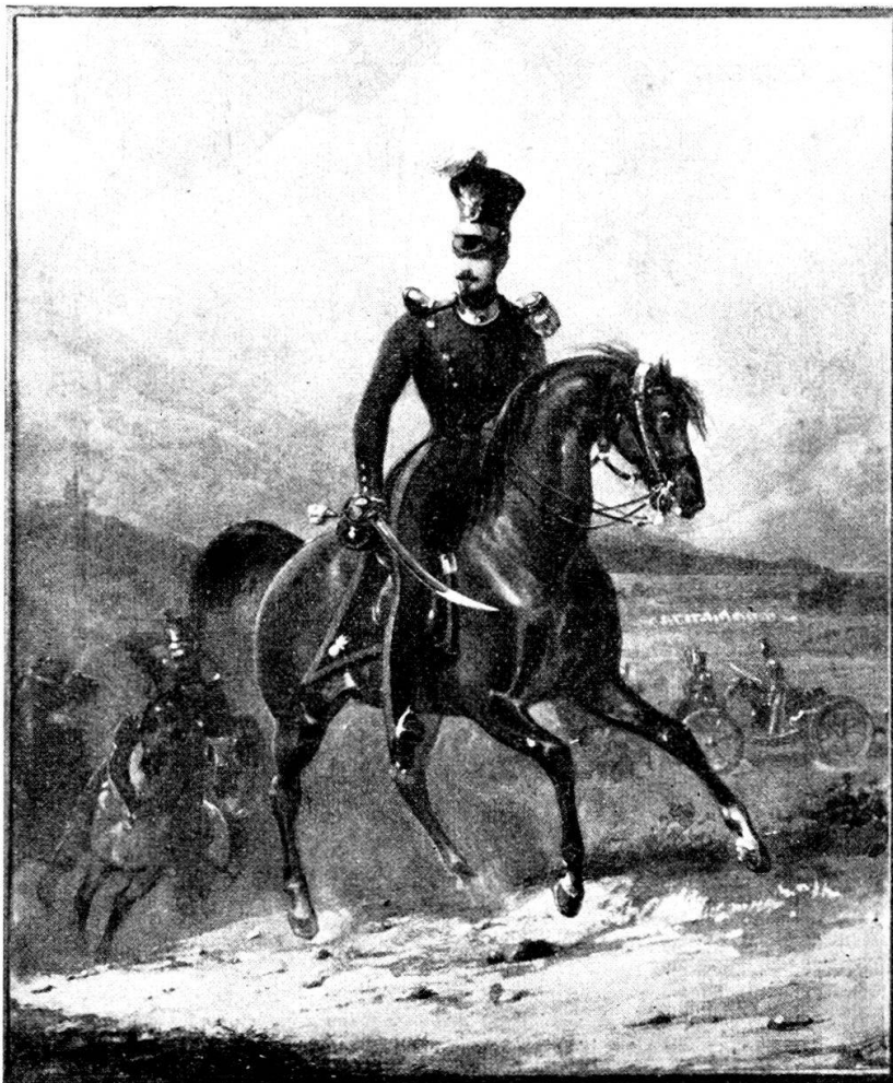
Carlo Luigi Napoleone nel 1834 in uniforme di capitano d'artiglieria dell'Esercito Svizzero (acquarello - pittore Cottreau)

Arenenberg, sulla riva svizzera del lago di Costanza, nel Comune di Salenstein, è l'idilliaca proprietà che Ortensia di Beauharnais — figliastra di Napoleone I e sposa del di lui fratello Re dei Paesi Bassi, cui aveva dato tre figli fra i quali Carlo Luigi Napoleone, dive-