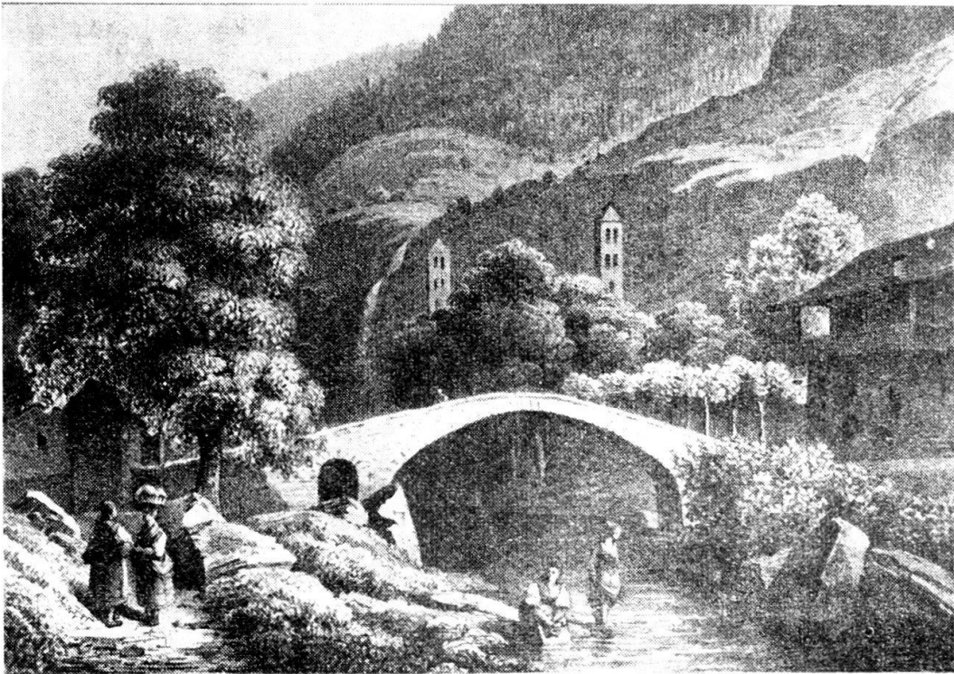
Giornico in una vecchia stampa: il ponte sul Ticino ed il campanile della chiesa di San Nicolao (a destra).

Quando, dopo il 1870, i prigionieri furono trasferiti al Penitenziario cantonale costruito a Lugano, divennero disponibili per l'arsenale nuovi locali, tra cui le prigioni femminili ove venne installata la prima sala d'armi.