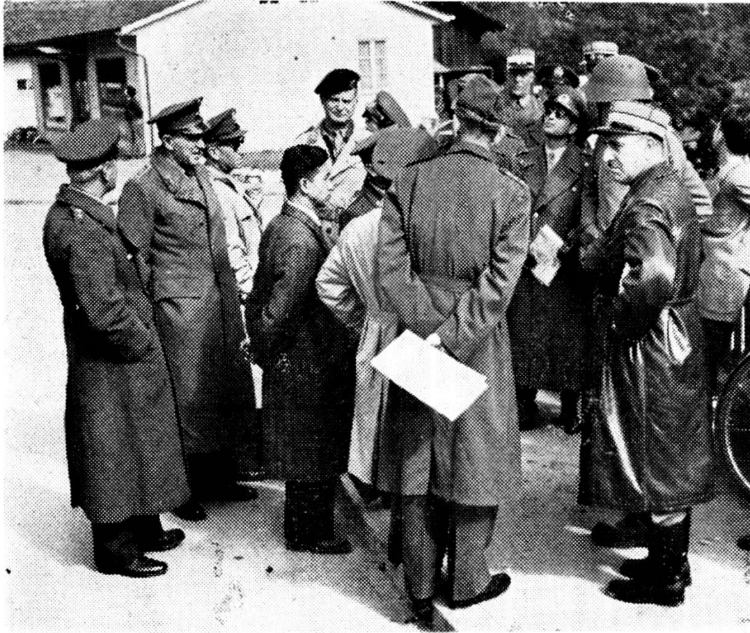
Addetti militari esteri hanno seguito le manovre.

Passarono così per quasi cinque ore consecutive, secondo l'ordine di battaglia, 25.000 uomini, 3.000 autoveicoli, 700 cavalli, 30 carri armati, 50 aeroplani, di cui la metà a reazione: una massa impressionante di uomini e mezzi, come finora da noi non era mai stata veduta, accolta dall'entusiastico applauso dei presenti.