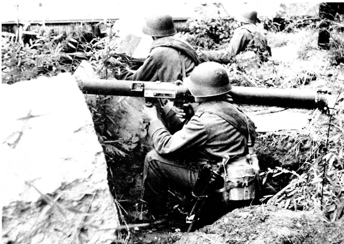
SVIZZERA : Lanciarazzo anticarro 8,3 cm.