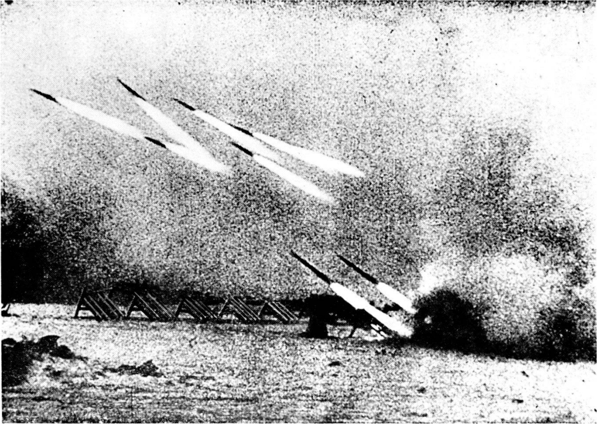
U. R. S. S. fuoco di batteria di lanciarazzi « Katiuschka »