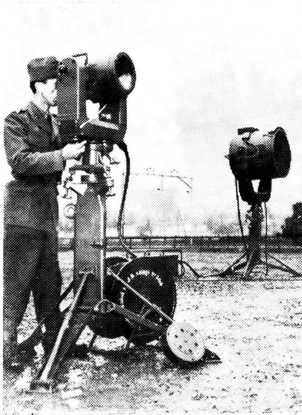
Telescopio elettronico con riflettore di raggi infrarossi