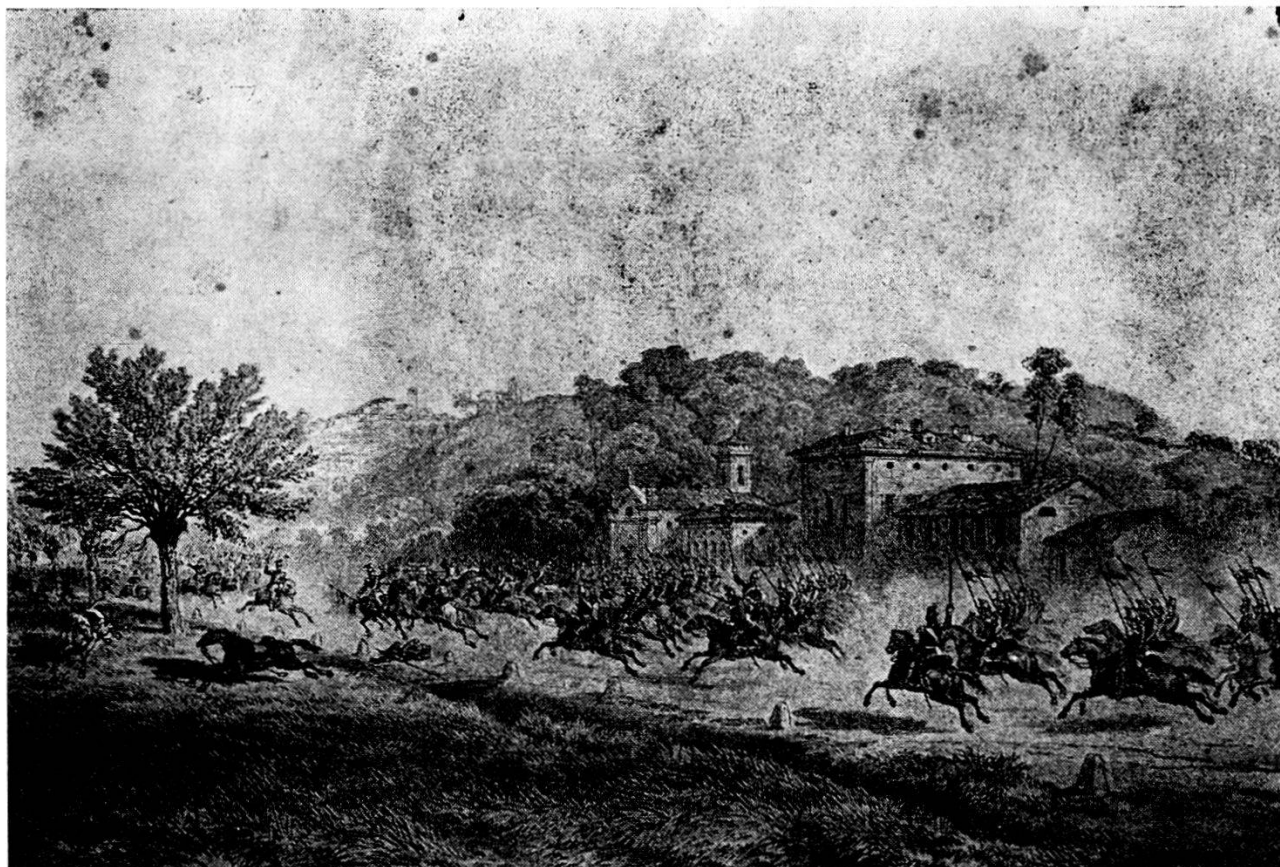
1859 : Cavalleggieri del Piemonte a Genestrello (litogr. da un disegno di CARLO BOSSOLI)