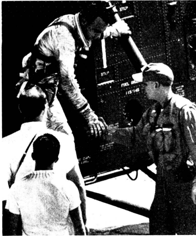
Aln B. Shepard lascia l'elicottero che lo ha raccolto nell'Atlantico pochi minuti prima al termine del volo spaziale suborbitale da Cape Canaveral.