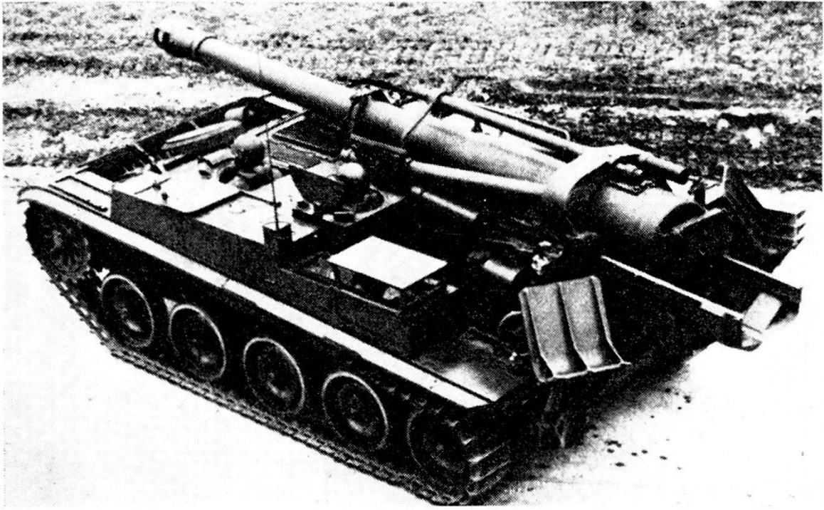
Il nuovo obice semovente francese calibro 15.5 cm. fissato su scafo AMX