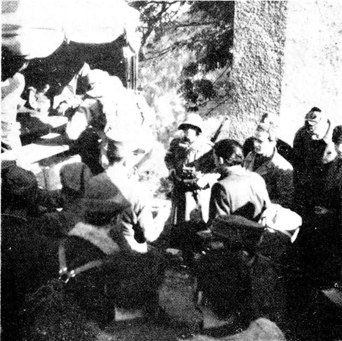
Spruga, ottobre 1944: partigiani in attesa di varcare il confine svizzero.

Il Violante dunque, con tono arrogante, spalleggiato da un giovane subalterno altrettanto prepotente, rivolge un'assurda richiesta al capitano Bernasconi.