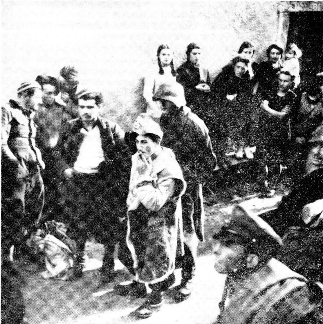
Spruga, ottobre 1944: i partigiani entrati in territorio svizzero, scampati al rastrellamento nazi-fascista, vengono portati a Locarno dall'esercito svizzero.

direttrice Craveggia-bocchetta di Sant'Antonio-Bagni di Craveggia. Chi ha visto solo una volta il posto si rende conto che per i fascisti, in posizione dominante, sarebbe stato facilissimo avere ragione di quella povera gente, imbottigliata nel classico cul di sacco.