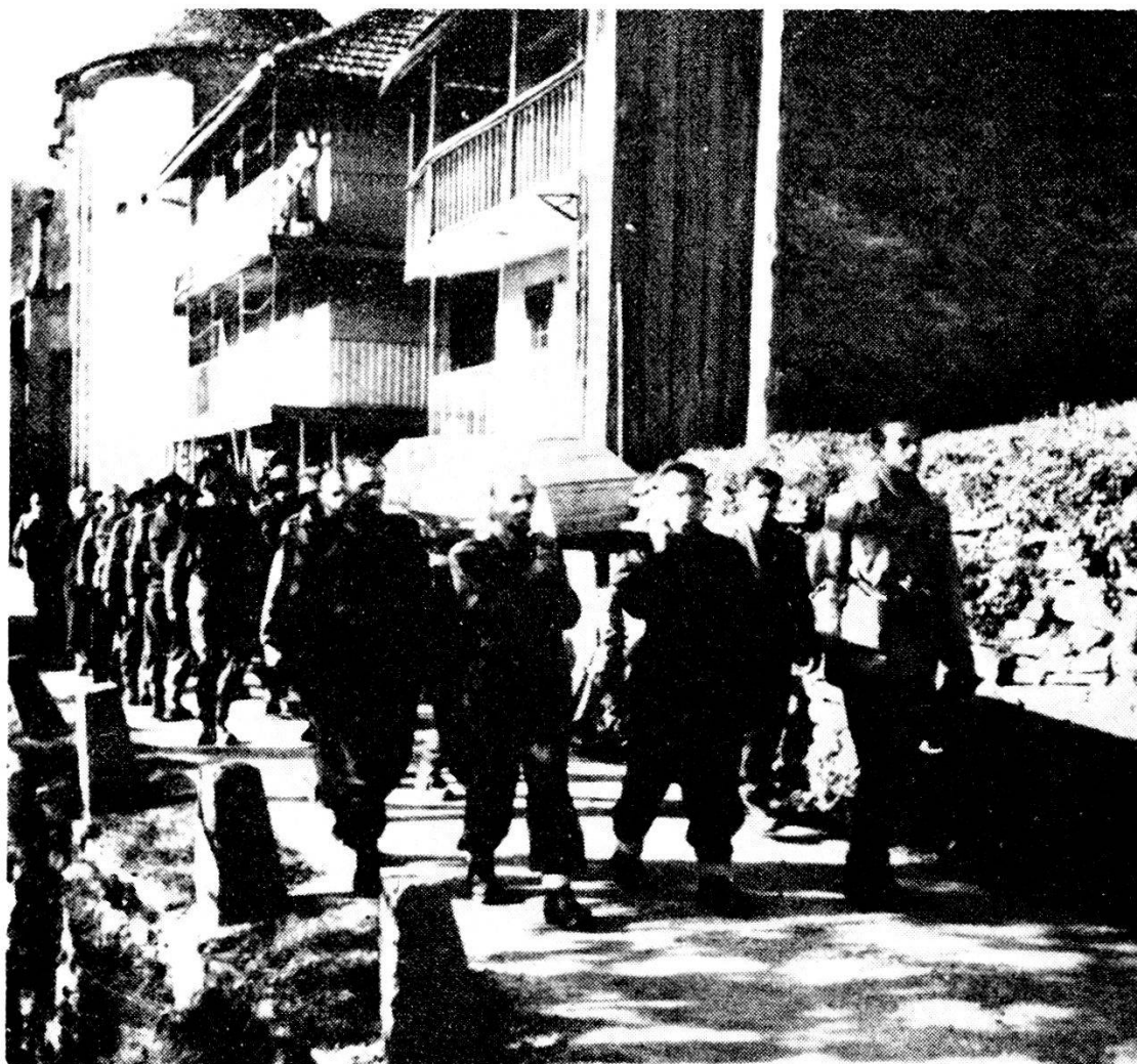
Spruga, 20 ottobre 1944: i funerali del tenente Marescotti. La bara portata a spalla dai partigiani è seguita da un reparto armato svizzero.

giani fatti uscire da un campo d'internamento per rendere l'ultimo saluto a quel valoroso.