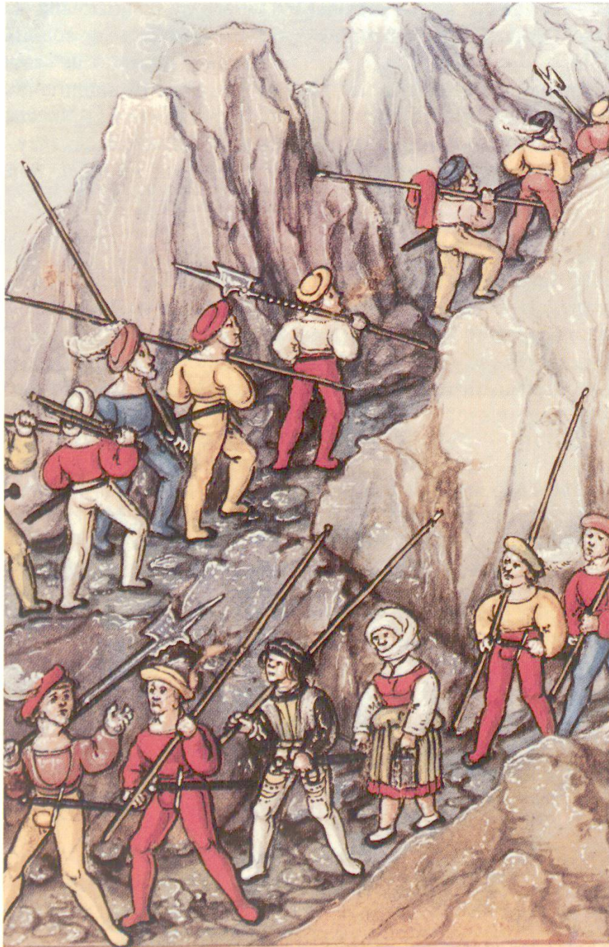
Mercenari svizzeri al servizio della Francia, al San Gottardo Diebold Schilling. Luzerner Chronik. Faksimile Verlag, Lucerna.