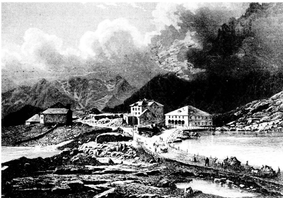
Il Passo del San Gottardo verso il 1850. A destra la vecchia sosta.

Nella parte militare del museo si mette in evidenza come il Passo del San Gottardo, importante politicamente, economicamente e culturalmente, sia diventato