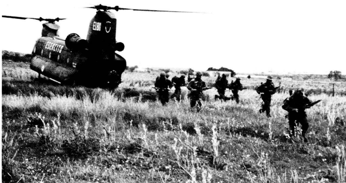
L'elitransporto consente alle fanterie leggere un alto grado di mobilità.