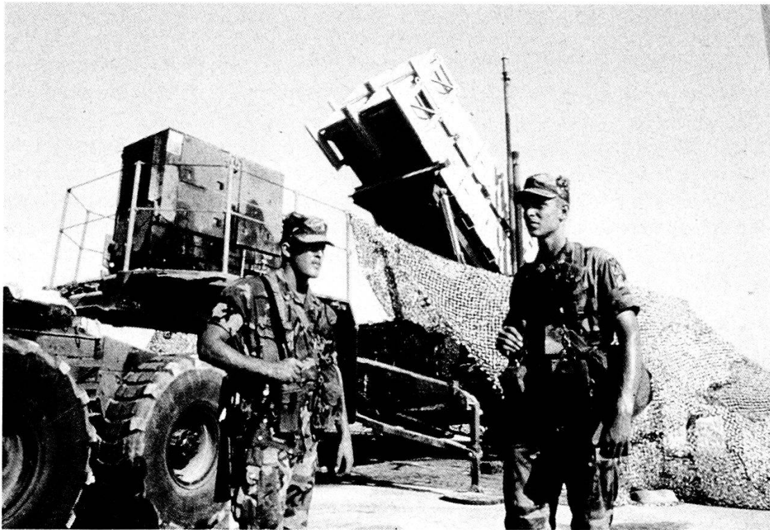
«Scudo nel deserto» - Patriot della 11ma Brigata Antiaerea USA.

Lo scenario europeo è oggi caratterizzato da un alto grado di fluidità ed almeno nei tempi medio-brevi permarrà nel Continente una linea di demarcazione fra due mondi, certamente meno lontani, ma ancora politicamente, economicamente e militarmente separati.