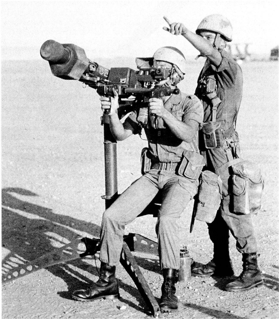
«Scudo nel deserto» - Missile contraerei Mistral - 18mo Rgt Art Marina francese.