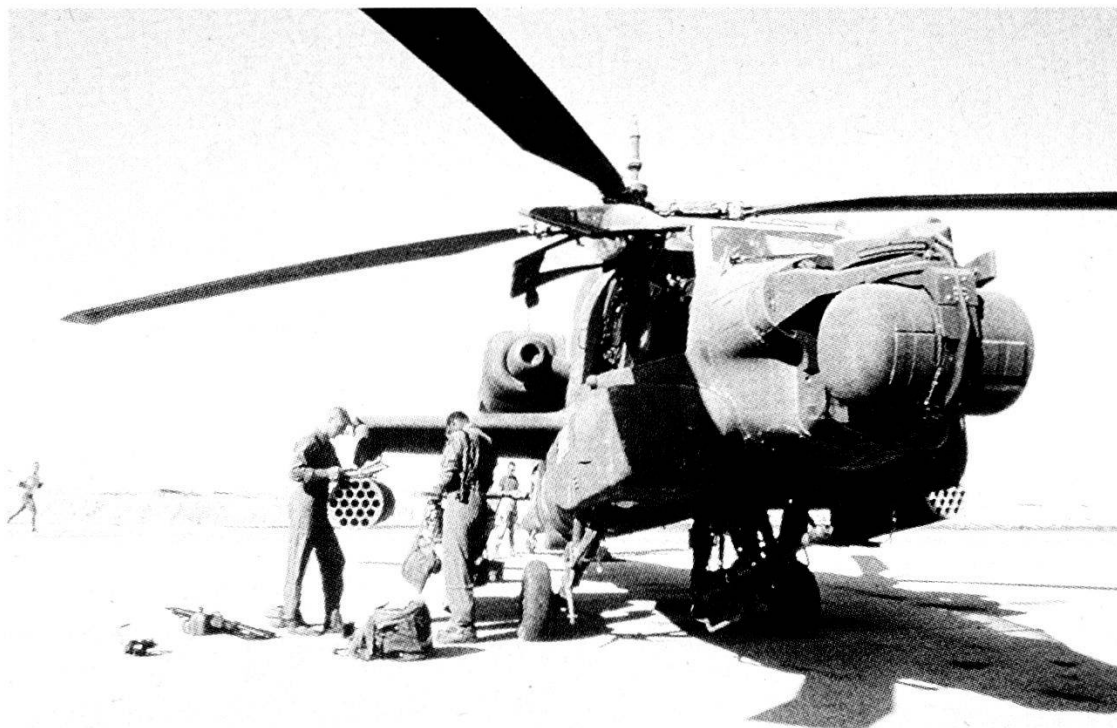
«Scudo nel deserto» - Elicottero AH-64A Apache (USA).

là degli Urali non prelude alla loro totale distruzione. Il Generale Moiseev è un convinto assertore dello «sviluppo qualitativo» ed a ciò tende chiaramente la spesa militare sovietica che continua a restare sproporzionata rispetto alle altre voci, nonostante la gravissima crisi di tutti gli altri settori dello Stato.