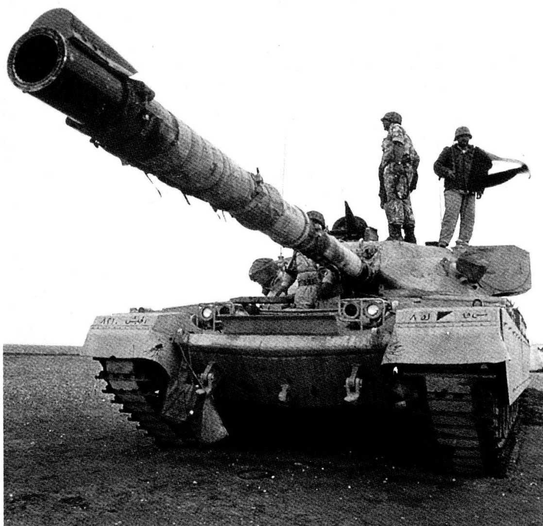
«Scudo nel deserto» - Carro Chieftain della Brigata dei «Martiri» dell'esercito del Kuwait.