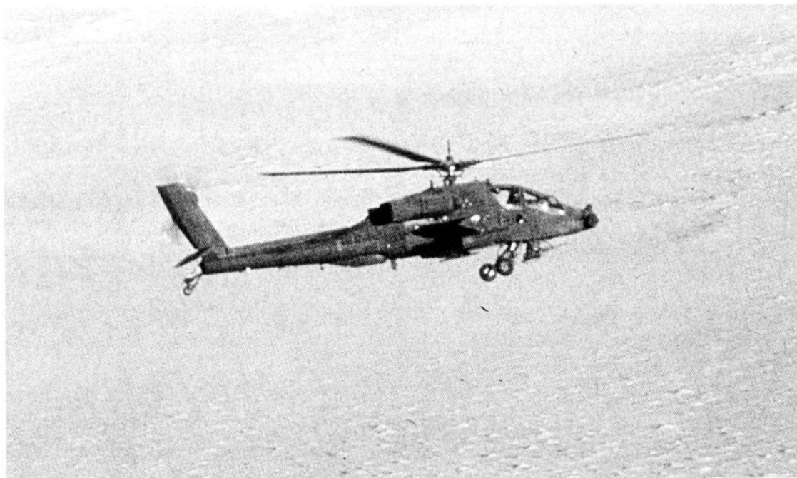
«Scudo nel deserto» - Elicottero da cbt «Apache» (USA).

teggersi sarà preso sul serio ed ascoltato anche e soprattutto nel dialogo per la distensione».