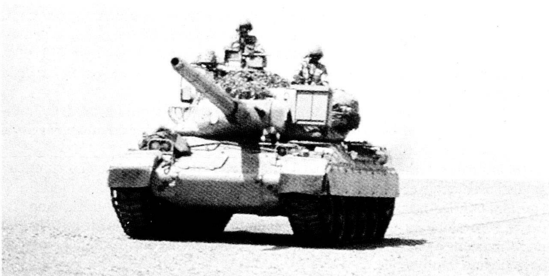
Carro AMX-305 dell'Esercito saudita.

Allo stato attuale la provenienza della minaccia per i Paesi dell'Europa occidentale, quindi anche per l'Italia, ed il suo peso restano pressoché invariati. L'Unione Sovietica, infatti, conserva una rilevante superiorità negli arsenali convenzionali, per non menzionare quelli nucleari. L'arretramento delle forze non significa la loro sparizione e la ridislocazione degli equipaggiamenti e dei sistemi d'arma al di