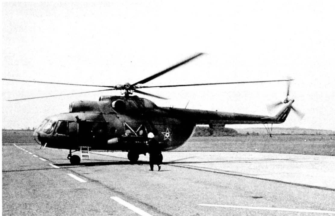
Elicottero Mil Mi-8 della Brigata elicotteri da combattimento delle Forze Armate ungheresi.

Francia con la partecipazione straordinaria del Piemonte, tutti preoccupati, soprattutto l'Inghilterra, di contenere in funzione antirussa la decomposizione dell'Impero Ottomano. A partire appunto dal XIX secolo i nascenti Stati Balcanici, a somiglianza di quanto avviene nello stesso periodo in Italia, iniziano a sottrarre terreno e indipendenza ai Turchi inserendosi nel gioco complesso e non sempre prevedibile delle Grandi Potenze. In particolare, e ciò avrà influenza sulla loro successiva scelta culturale, Croati e in parte i Serbi, pur nella loro scelta nazionale, si battono nell'ambito e, con il supporto della visione mitteleuropea dell'Impero Asburgico. Gli altri Stati Slavi e la Grecia, forse perché più periferici e per le loro peculiarità di tradizioni storico-culturali, si battono invece per l'indipendenza nello scenario di una più specifica e originale identità nazionale. I successivi grandi riassetto dell'area balcanica derivati dal Trattato di Berlino (1878), dalle guerre balcaniche (1912-'13) e dalla situazione conseguente dal primo conflitto mondiale, sanciscono la costituzione della Jugoslavia quale Stato egemone su Serbia, Croazia e Slovenia, allargano i confini della Romania e tagliano la Bulgaria dal