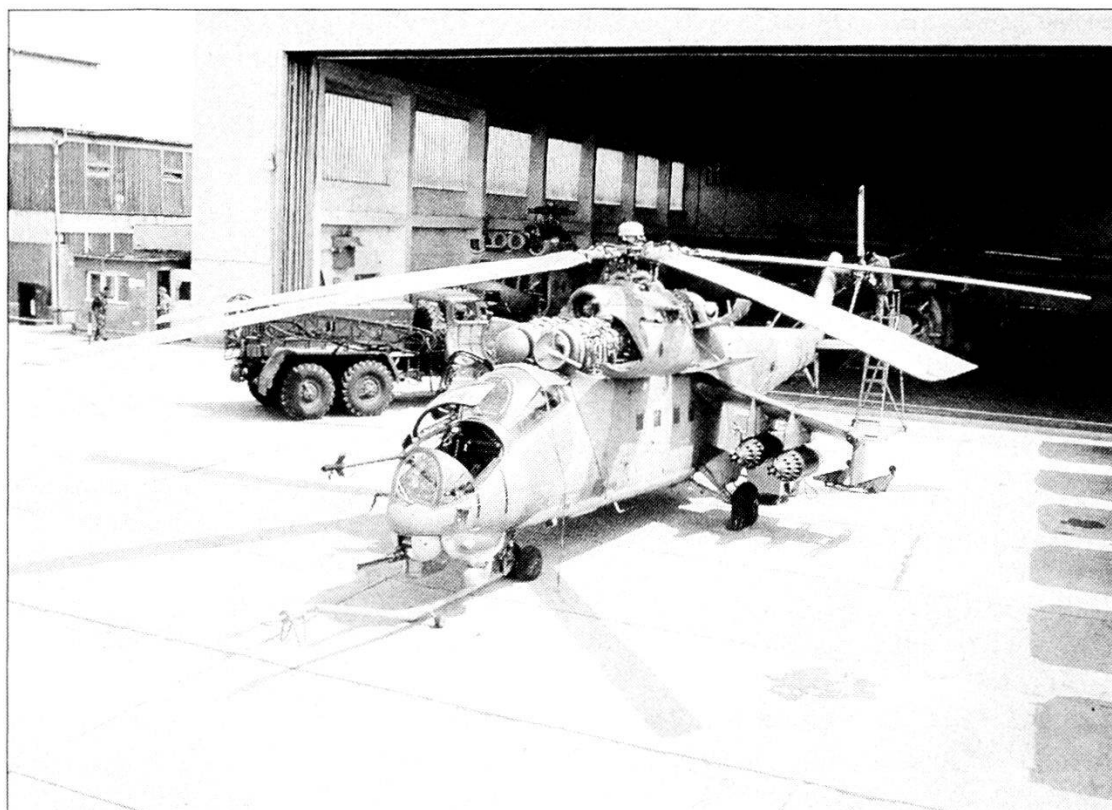
L'elicottero «Hind» è armato con 64 razzi da 57 mm, 4 missili controcarri AT6 e una mitragliatrice a 4 canne rotanti calibro 12,7 mm.

tabile conseguenza di un tenore di vita drammaticamente basso. La Romania è stata ed è il Paese in area balcanica che mantiene i migliori rapporti con la Jugoslavia sia nel settore economico che in quello politico. Infatti è il solo a non avere con questa alcun tipo di rivendicazione o comunque rancore che si basi su precedenti storici o sull'esistenza di minoranze etniche.