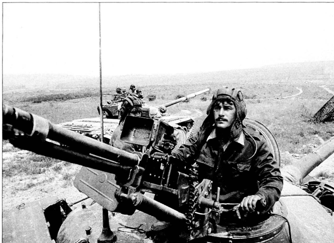
Carristi ungheresi in addestramento.

il 20%. Tale crisi è stata il prodotto inevitabile dell'assurdo economico dell'auto-gestione. Si tratta in sintesi di quel triste provvedimento che tuttora interessa industrie, scuole, ospedali, reti commerciali, banche, assicurazioni ecc... È un sistema che esclude una qualsiasi possibilità di politica economica e scoraggia ogni investimento estero mentre incoraggia la privatizzazione degli utili e la socializzazione delle perdite. Ed è stato appunto questo sistema a costringere la Jugoslavia a rapporti sempre più stretti con i Paesi Orientali, in quanto allineati nell'inefficienza, anche mediante il ricorso al baratto. E questo non potrà non condizionare pesantemente il futuro recupero a una libera economia di mercato. La competitività, essenziale per la sopravvivenza, mal si concilia con il socialismo cosiddetto reale. L'assenza di un effettivo potere politico centrale, che è stata poi una delle cause del disastro economico, non poteva che peggiorare il quadro d'insieme. Solo la leadership carismatica di Tito poteva garantire una direzione centralizzata o almeno