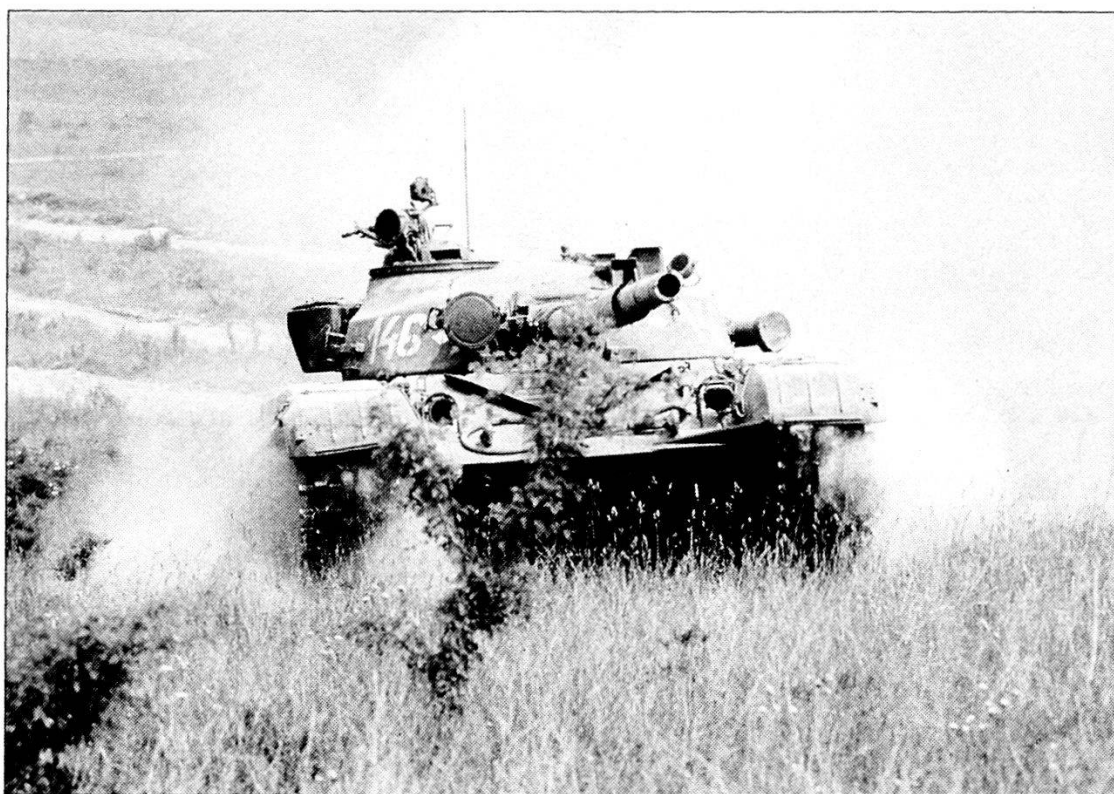
Carro T-72 ungherese della Brigata corazzata «Tata».

Non potranno che nascerne delle tensioni perché la coperta del benessere oltre a essere di non facile acquisizione è piccola e piuttosto sdrucita, e a tirarla da tutte le parti si aprirà in smagliature e strappi sempre più vistosi. Senza scomodare il Vico, si potrà ritornare, mutatis mutandis , a quelle condizioni di equilibrio squilibrato che hanno caratterizzato il secolo scorso. Probabilmente con una Santa Alleanza meno vistosa nei paludamenti e meno proterva, negli assunti, ma altrettanto preoccupata nell'ansia di preservare gli equilibri esistenti o magari anche solo il controllo degli armamenti nucleari. Ma a noi cittadini di questa soleggiata e già più felice penisola interessa soprattutto quanto in fieri nella vicina area balcanica. Tradizionale fonte di guai per l'Europa e della cui turbolenza e instabilità non possiamo non temere i contraccolpi. Pertanto un'occhiata non frettolosa alla sua collocazione geografica e agli eventi storici che vi si sono succeduti nel tempo, con attenzione più concentrata sulla confinante Jugoslavia, appare necessaria a migliore comprensione degli eventi attuali.