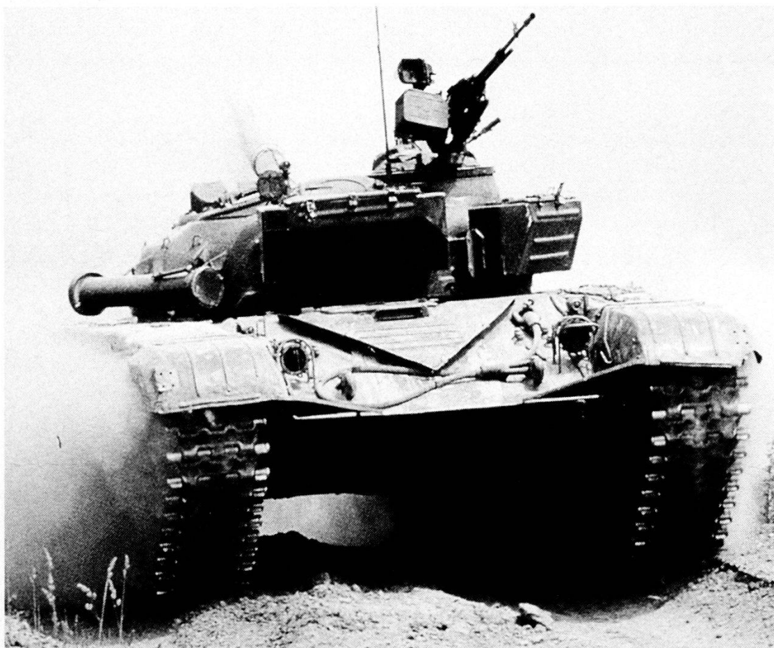
Il carro armato T-72 è in dotazione anche ai reparti corazzati dei Paesi Balcanici.

La geografia conferma la sua validità di scienza obiettiva poiché ci mostra come la Penisola Balcanica, quale naturale via di transito tra Oriente e Occidente, era già programmata a divenire luogo di tumultuoso accavallarsi di civiltà variegata per base etnica, credenze religiose e organizzazione sociale. Poco affollata fino al VI secolo di genti illiriche, romane e di robusti nuclei di quella copiosa varietà di popolazioni cosiddette barbare (Celti, Goti, Unni), vede poi l'inizio della sua caratterizzazione etnica con l'immigrazione di genti slave dall'area carpatica e la slavizzazione nel VII secolo di precedenti stanziamenti mongoli nell'attuale Bulga-