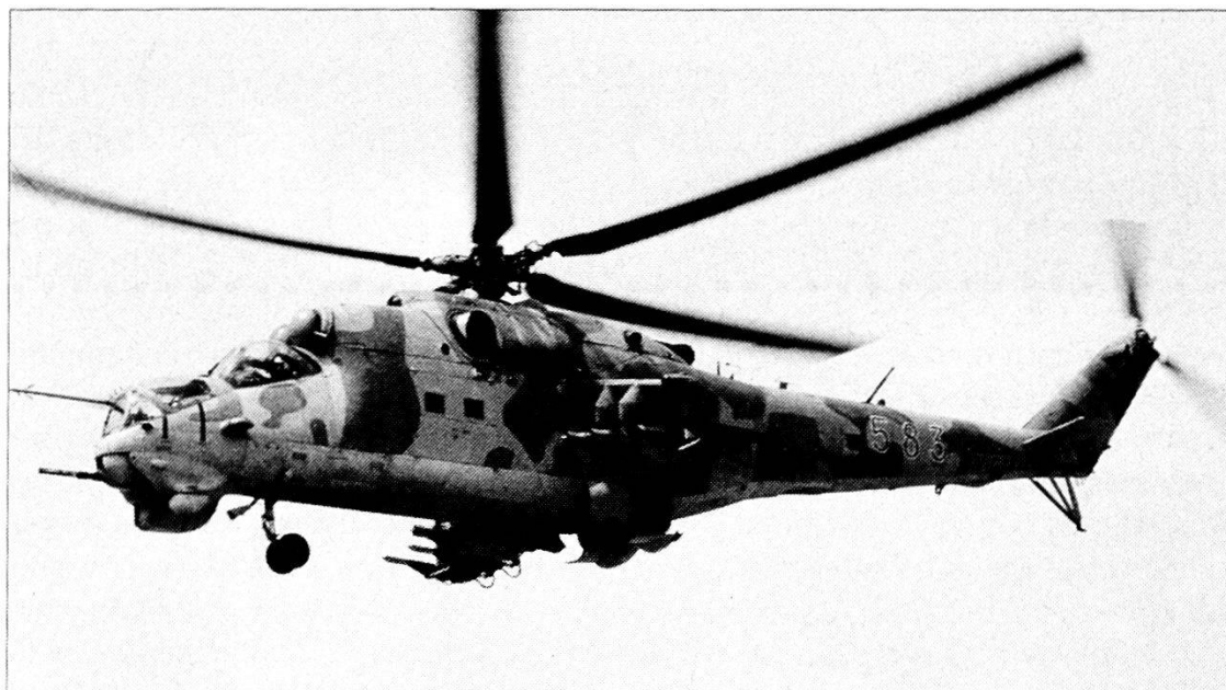
Elicottero controcarri Mil Mi-24D «Hind».

Iniziamo dall' Ungheria . Le battaglie politiche del primo dopoguerra intese a definire il futuro assetto del Paese registrano un'immediata e progressiva imposizione