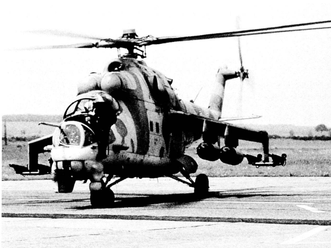
L'elicottero Mil Mi-24 è in grado di trasportare oltre ai 3 uomini di equipaggio 10 soldati in assetto da combattimento o un carico di 2850 kg.

Che la Slovenia e la Croazia ottengano la loro indipendenza e che la Slovenia mantenga la sua integrità territoriale, mentre la Croazia perda non poche penne, si può dire che è nell'ordine naturale delle cose. Senza entrare nel merito dei diritti, dei demeriti e delle colpe, ce ne sono da una parte e dall'altra, il sanguinoso conflitto serbo-croato, a parte le sue motivazioni storico-culturali, ha soprattutto una forte valenza politico-economica. Infatti, come appare evidente anche a un distratto lettore della carta geografica, da una disgregazione della Repubblica Federale sarà in ogni caso la Serbia, grande o piccola che ne risulti, a pagarne le spese. Infatti delle altre Repubbliche, la Bosnia, che è la più grande e popolata, appare già oggi orientata a proclamare la sua indipendenza. Le altre hanno poca rilevanza economica e demografica e comunque appaiono tutte più o meno in ansia