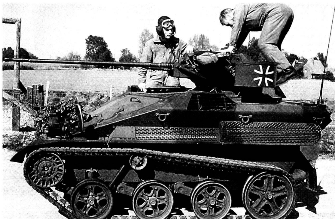
Un Wiesel dei parà tedeschi; una Brigata aeromobile fa parte della Divisione multinazionale che opererà nell'ambito delle Forze di Reazione Rapida.