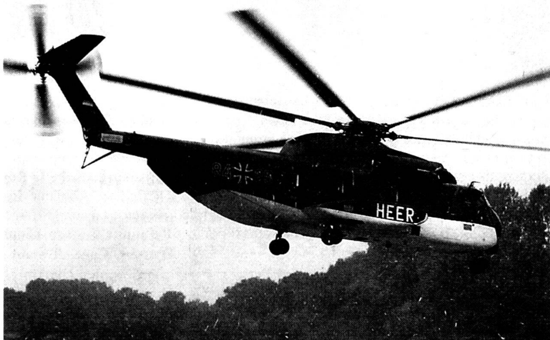
Un Ch-53 dello Heeresflieger in decollo: le formazioni aeromobili acquisiscono una sempre maggiore importanza vista la riduzione della densità delle forze.