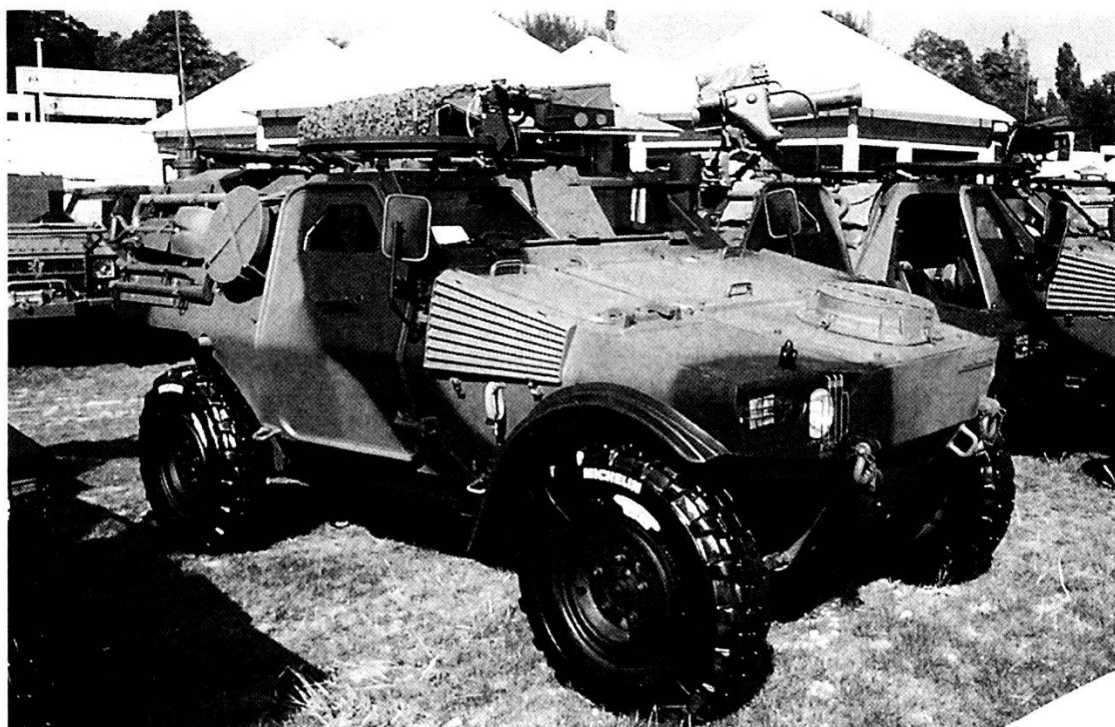
L'Esercito tedesco ha emesso un requisito per l'acquisizione di blindati ruotati leggeri.