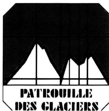
Auto-adesivo della Patrouille des glaciers