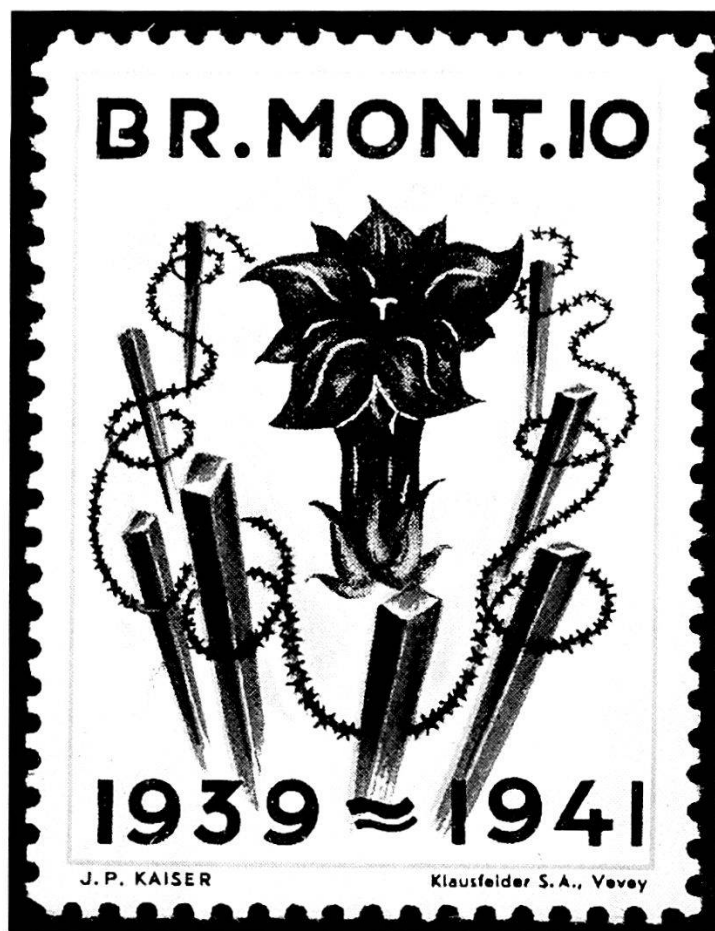
Ingrandimento di un «francobollo dei soldati» della br mont 10 (dalla collezione personale dell'autore del presente articolo)