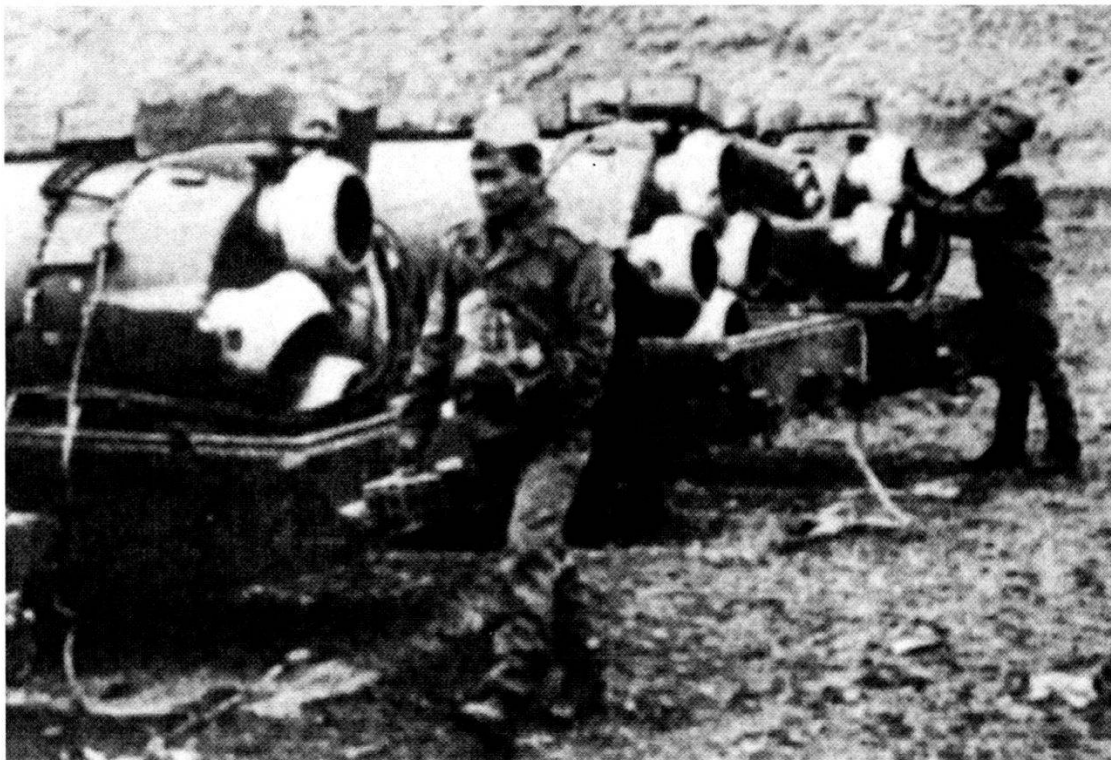
Distruzione di razzi sovietici SS-12/22 (Scaleboard) secondo contratto INF.