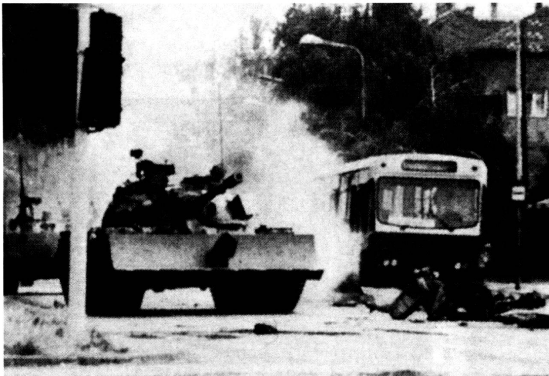
Il pericolo di conflitti locali e regionali è in notevole aumento (Foto: crisi in Jugoslavia).