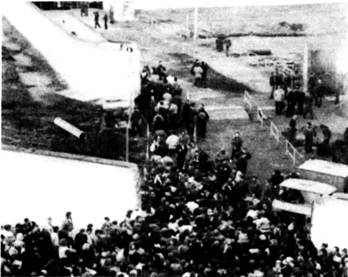
Le condizioni quadro modificate richiedono un nuovo sistema di sicurezza per l'Europa (foto: caduta del Muro di Berlino).

La situazione a livello di strategia militare europea degli ultimi decenni fu caratterizzata in prevalenza dall'eventualità di conflitti tra i due blocchi di potere, Patto di Varsavia e NATO, nonché dalle conseguenze di un tale conflitto ovvero da una stabilità costituita dall'«equilibrio del terrore». Un lungo periodo, che parte dal «balance of power» (equilibrio delle forze) puramente militare, dalla «teoria del