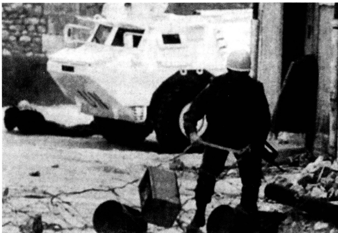
Impiego di soldati dell'ONU in Jugoslavia.