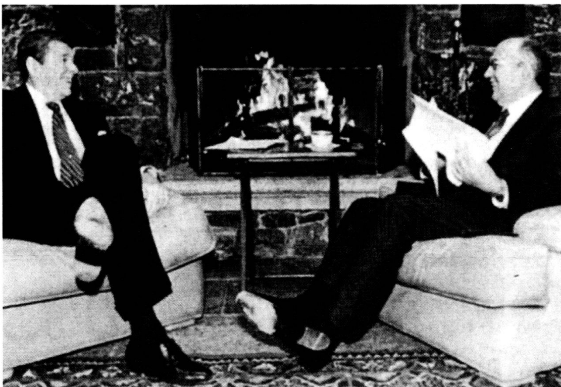
La politica di distensione introdotta da Reagan e Gorbatschow rese possibili i cambiamenti a livello della politica di sicurezza degli ultimi anni.