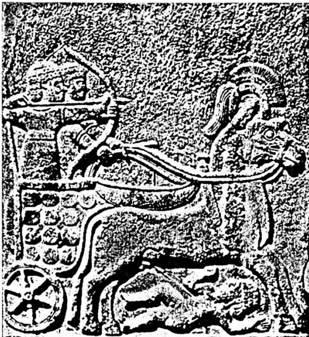
Carro da guerra ittita, bassorilievo proveniente da Karkemish, città posta al guado dell'Eufrate che conduce dalla Siria alla Mesopotamia (ora Cerablus). Reperto trovantesi nel museo di Ankara.

to era composto di fanteria e di carri: l'armamento dei combattenti montati su quest'ultimi, i nobili, consistevano in lancia, arco e scudo. I fanti erano armati di lance e spade.