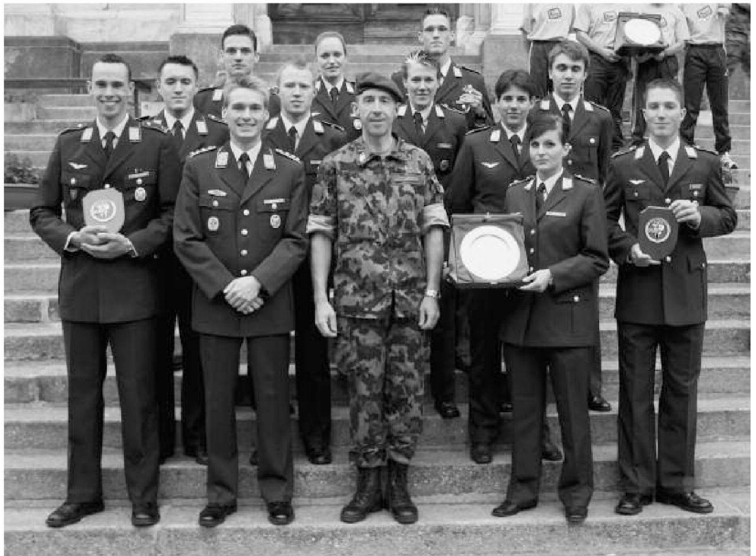
Pattuglie della scuola ufficiali delle Forze Aeree della Bundeswehr alla premiazione

Quest'anno la gara avrà un aspetto internazionale vista la partecipazione di pattuglie della scuola ufficiali delle Forze Aeree della Bundeswehr nonché quelle die paracadutisti di Monza e dell'UNUCI (Unione nazionale degli ufficiali in congedo italiani) di Trento. ■