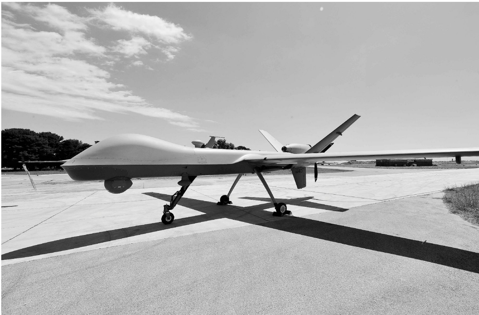
Velivolo teleguidato REAPER.