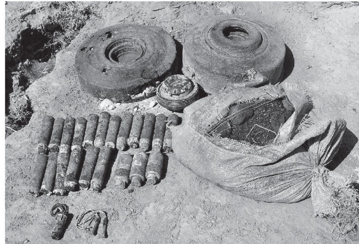
Esplosivi recuperati da vecchie munizioni per realizzare ordigni improvvisati.

Nonostante i successi tattici conseguiti la strategia obamiana presenta anche diversi limiti. Uccidere leader che vengono rapidamente rimpiazzati non sembra essere risolutivo, i danni collaterali creano problemi e tensioni con i governi locali così come l'assenza di "boots on the ground" impedisce agli statunitensi il controllo del territorio lasciando in molti casi campo libero alle milizie jihadiste come è accaduto in settembre a Bengasi dove i miliziani hanno potuto attaccare indisturbati il consolato