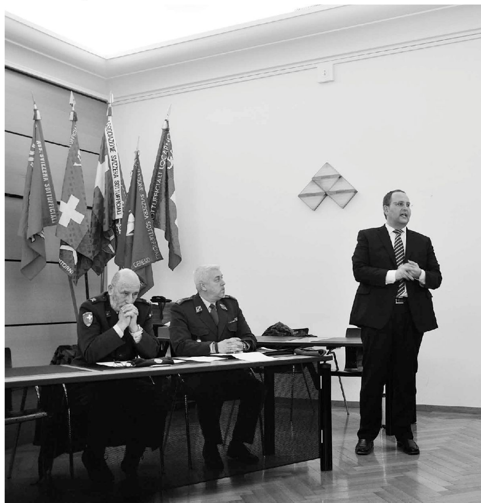
Il saluto del Consigliere di Stato

Alla fine la conferenza di chiusura è stata presentata dal Col Mauro Antonini, comandante della Zona 3 delle Guardie di Confine, che ha illustrato i compiti del corpo con un accento dettagliato sulle nuove tecniche e su alcuni dettagli operativi per i quali le Guardie di Confine possono operare al meglio nel novero della nuova definizione del loro mandato. ■