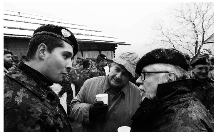
Giovani e anziani si incontrano

Il 25 luglio Guisan ordinò ai suoi comandanti di recarsi sul praticello del Grütli per trasmettere il suo messaggio poco prima del 1° agosto, anniversario della fondazione del nostro Paese. Per infondere loro fiducia. Per fare appello alle proprie capacità militari. In questo luogo scarso, Guisan voleva rivolgersi ai suoi comandanti nel momento di massima minaccia e pericolo guardando loro negli occhi come camerata, capo e soldato. Concluse il rapporto dicendo: « Je vous charge de transmettre cette consigne à vos troupes. J'ai confiance en vous. L'ordre d'armée sera distribué sur le bateau » . ■