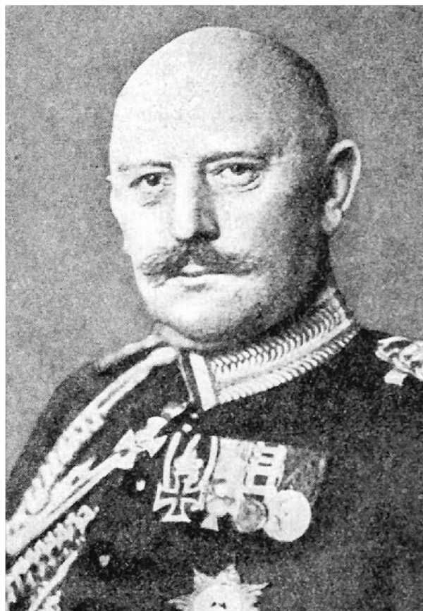
Helmut Johannes Ludwig von Moltke ("Moltke il giovane")