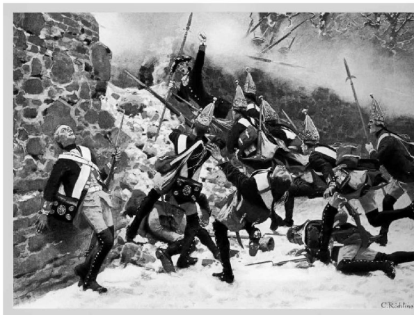
Battaglia di Leuthen, assalto al portale della chiesa

La realizzazione del piano di Schlieffen da parte di Moltke Quando nel 1914 scoppiò la guerra Schlieffen era già morto. Il suo successore, Helmut von Moltke, si distanziò in due punti dal piano Schlieffen.