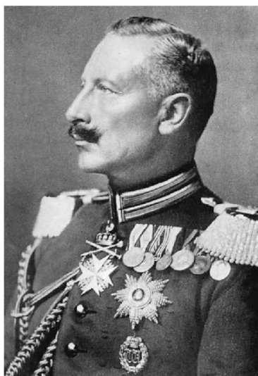
Imperatore Guglielmo II

Nel 1904 Francia e Gran Bretagna conclusero l' "Entente cordiale", che non era però concepita contro la Germania, bensì voleva essere un tentativo per regolare la sfera di influenza dei due Stati in Africa, soprattutto riguardo alle due colonie Marocco (Francia) e Egitto (Gran Bretagna). Quando nel 1907 la Russia firmò un accordo tra la Francia e la Gran Bretagna per regolare i conflitti che si verificavano soprattutto nel Sud dell'Asia, si giunse in Europa alla formazione di due grandi blocchi di alleanze. Da