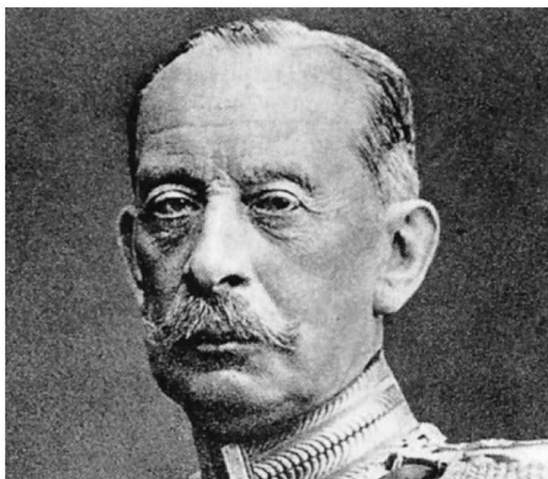
Feldmaresciallo von Schlieffen

Nascita del nazionalismo in Europa, soprattutto nei Balcani Con il crescente crollo dell'impero ottomano, si formò nei Balcani un vuoto di potere, che nazionalisti serbi vollero utilizzare per fondare un grande impero serbo. Obiettivo di questi nazionalisti serbi era di riunire tutte le regioni nelle quali vivevano cittadini serbi con il Regno serbo. Con ciò si trovarono in conflitto con l'Austria-Ungheria, la quale nel 1908 annesse le province della Bosnia e dell'Erzegovina, che erano state già occupate nel 1878, e dove vivevano molti Serbi. La Russia si assunse sempre più il ruolo di protettrice di tutti gli Slavi e sostenne quindi anche le aspirazioni dei nazionalisti serbi. L'attentato a Sarajevo del nazionalista serbo-bosniaco Gavrilo Princip (1894-1918) all'Arciduca Francesco Ferdinando (28 giugno 1914), erede al trono dell'Austria-Ungheria, è da inquadrare in questo contesto.