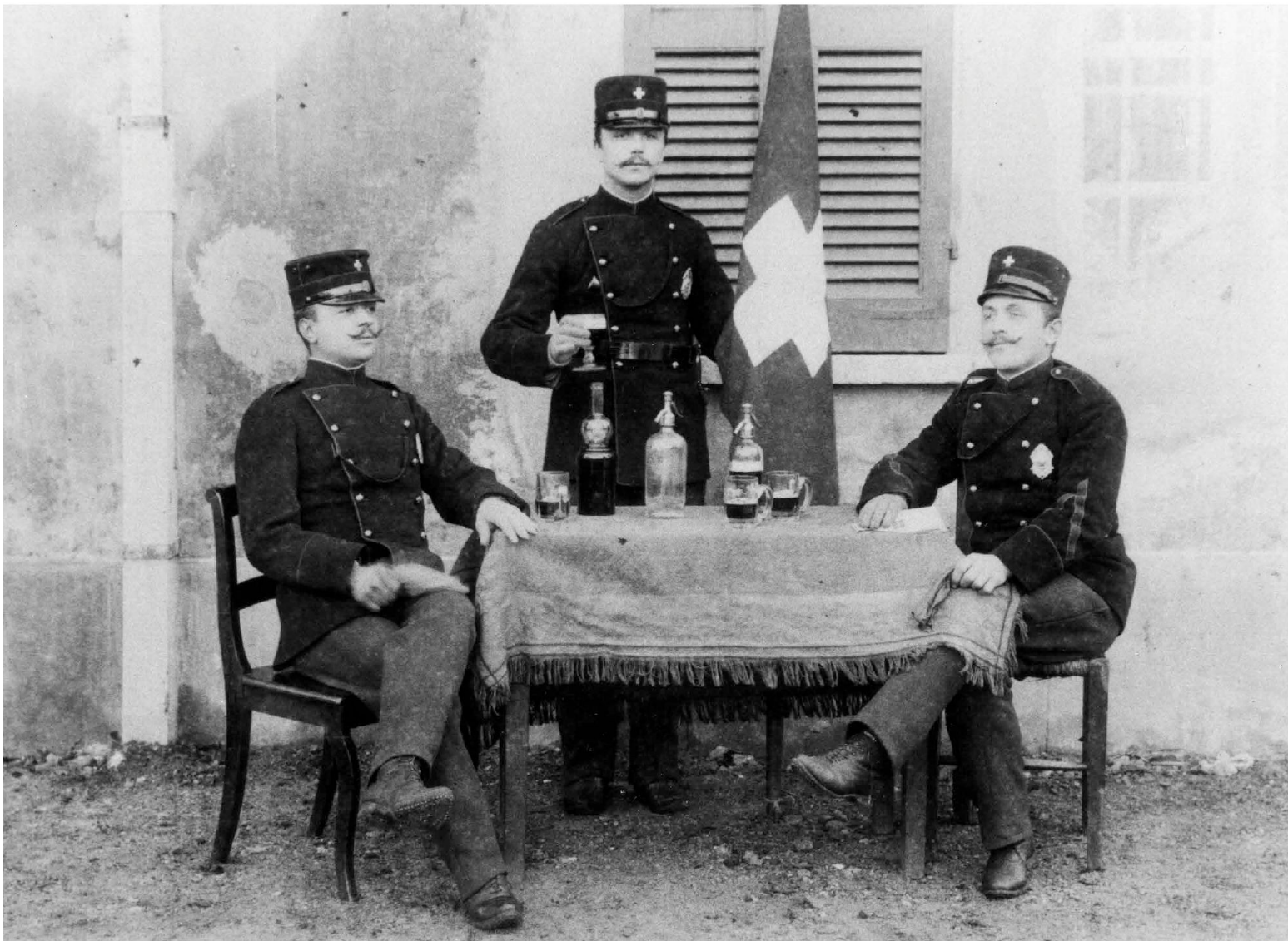
Tre guardie di confine federali a Chiasso nel 1895