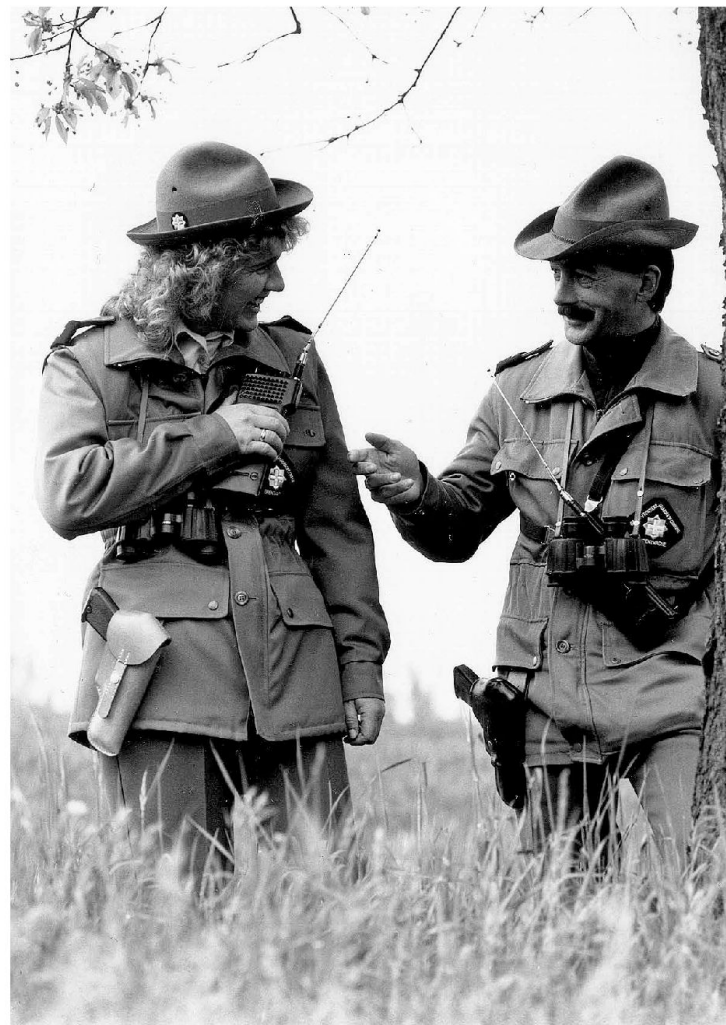
Pattuglia mista gcf 1991

Rispetto alle mansioni originali prettamente doganali, con l'avvento della motorizzazione, dei viaggiatori per lavoro e turismo, con l'aumento negli anni ottanta dei flussi migratori, l'esodo causato dalle guerre in ex Jugoslavia, le primavere arabe e i conflitti in africa e medio oriente, con una criminalità transfrontaliera sempre più aggressiva, la parte dei compiti di polizia di frontiera ha acquisito viepiù importanza.