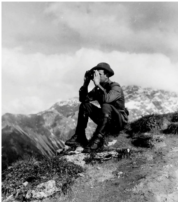
Guardia di confine in alta montagna nel dopoguerra

sposizione importanti strumenti informatici per il contrasto delle attività criminali (il SIS).