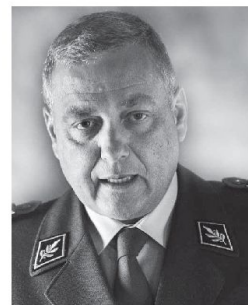
Brigadiere Denis Froidevaux

L'ulteriore evoluzione dell'Esercito (USEs) è entrata nella fase cruciale, il messaggio del Consiglio federale si trova fra le macine del Parlamento, precisamente del Consiglio degli Stati. In un'audizione effettuata con la Commissione politica di sicurezza del Consiglio degli Stati, la Società Svizzera degli Ufficiali (SSU) ha fermamente ribadito che il progetto USEs deve essere assolutamente portato a termine con alcuni adattamenti.