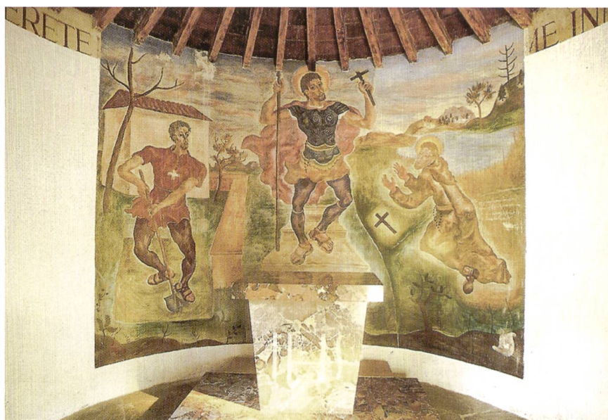
Affresco di Felice Filippini originale, raffigurante "Bruder Klaus", nella "Chiesetta dei soldati" al Monte Ceneri

La convivenza pacifica, la capacità di rimetterci in discussione (ricordiamoci che San Nicolao ha abbandonato la carriera per