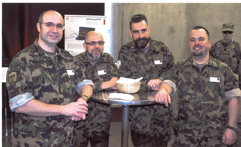
Il "team" ticinese

simulatori di condotta e altri mezzi d'istruzione. Il comando delle scuole centrali nel 1995 divenne comando della "scuola di stato maggiore e dei comandanti", con sede a Emmen, integrando la scuola di stato maggiore generale nel 1997, gestendo il centro di allenamento tattico ( Taktisches Trainingszentrum , TTZ) di Kriens, sviluppando un nuovo corso per aspiranti alti ufficiali di stato maggiore e accompagnando la ristrutturazione della Meilikaserne presso l'Allmend di Lucerna nel nuovo centro d'istruzione dell'esercito ( Armee-Ausbildungszentrum , AAL).