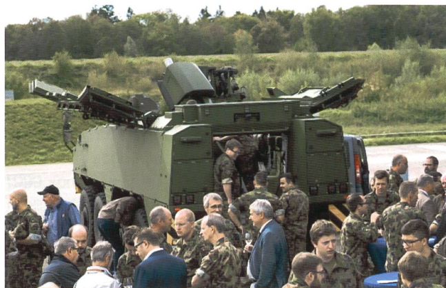
La SSUART al passo con i tempi: la visita al mortaio 16