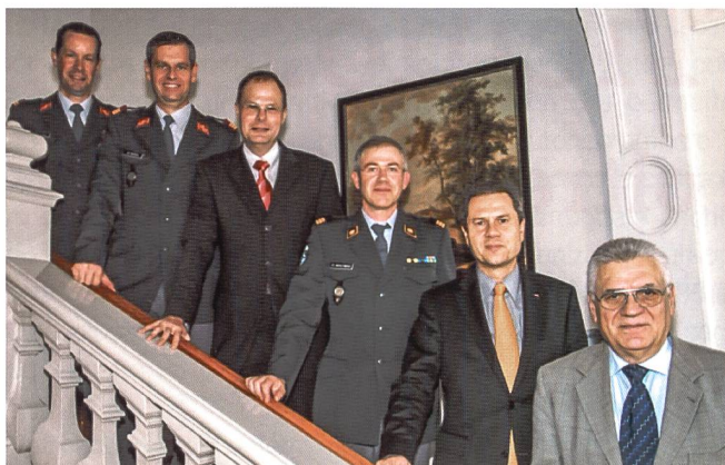
L'artiglieria plasmata "pionieristicamente": i passati presidenti della SSUART

Per la SSUART è dunque importante poter definire in tempi brevi il catalogo dei requisiti per un'artiglieria moderna, in modo da poter garantire la sostituzione dei componenti essenziali del sistema d'arma dell'artiglieria a partire dal 2025. ♦