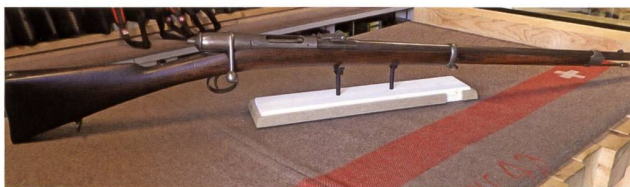
Vetterli dei cadetti Ticinesi.