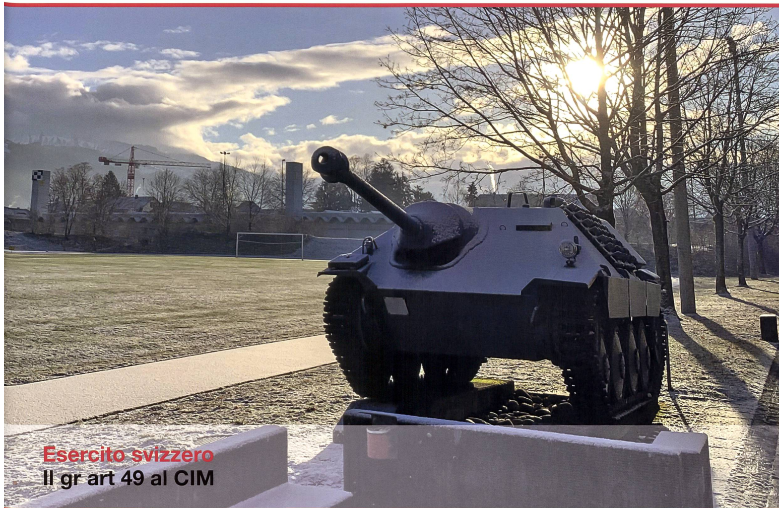
Esercito svizzero Il gr art 49 al CIM