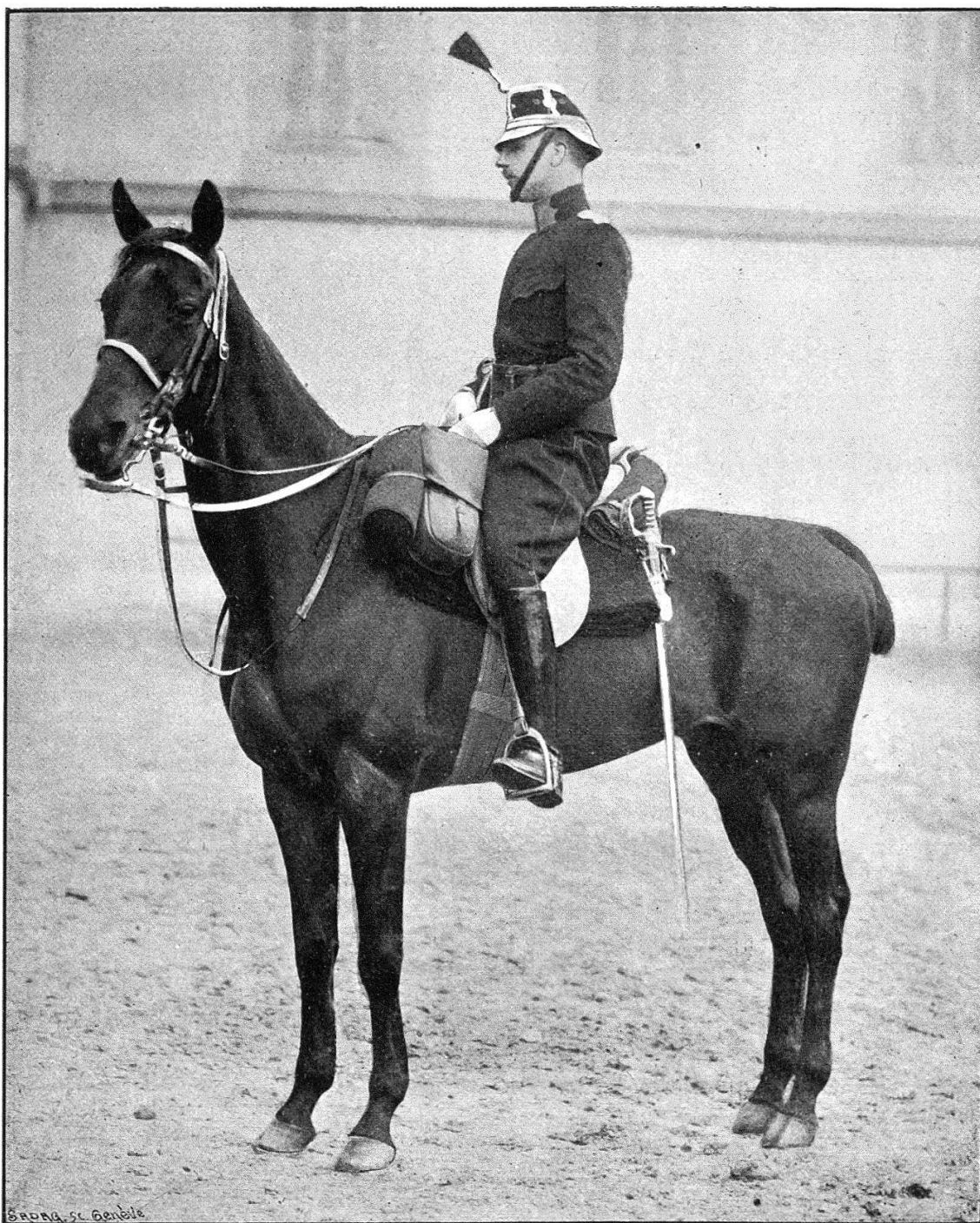
Le nouvel équipement de cheval d'officier.